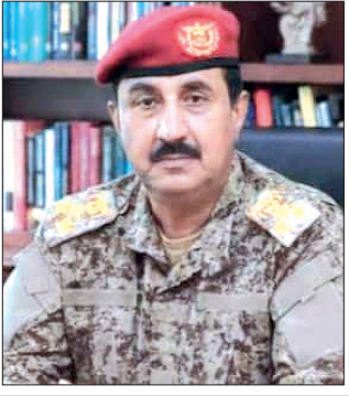
العميد طارق علي ناصر هادي

تمر علينا اليوم الذكرى الحادية عشرة لاستشهاد الوالد القائد والمعلم، اللواء الركن علي ناصر هادي، الذي لم يكن مجرد قائد عسكري، بل كان روح المقاومة في عدن،