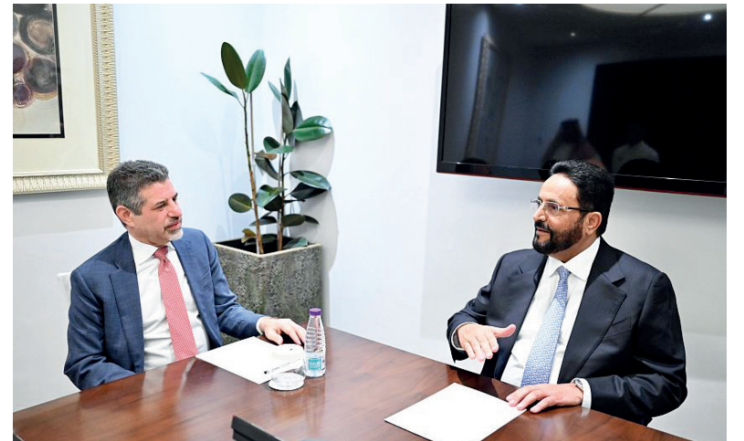
الرياض / سبأ :

أكد عضو مجلس القيادة الرئاسي، اللواء سلطان العرادة، أن المجتمع الدولي مطالب أكثر من أي وقت مضى، بمساندة بلادنا والوقوف إلى جانب مجلس القيادة، والحكومة في هذه المرحلة الاستثنائية، ودعم الجهود الرامية إلى استعادة مؤسسات الدولة، وتحقيق الأمن والاستقرار وإنهاء معاناة الشعب اليمني. جاء ذلك خلال لقائه، أمس، سفير الولايات المتحدة الأمريكية لدى اليمن، ستيفن فاجن، حيث جرى بحث مستجدات الأوضاع السياسية والاقتصادية والإنسانية، والتحديات التي تواجه الحكومة، وسبل تعزيز الاستقرار الاقتصادي.