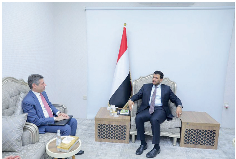
الرياض / سبأ :

استقبل عضو مجلس القيادة الرئاسي الدكتور عبدالله العليمي، أمس، سفير الولايات المتحدة الأمريكية لدى اليمن ستيفن فاجن، لبحث مسارات العلاقات الثنائية بين البلدين وسبل تطويرها، إضافة إلى مستجدات الأوضاع على الساحة الوطنية. وتناول اللقاء أولويات دعم الحكومة في هذه المرحلة، وبناء قدراتها، وتحسين الخدمات الأساسية في المحافظات المحررة، واستعادة الثقة بالمؤسسات التمويلية الدولية، بما يسهم في تعزيز التعافي الاقتصادي وتخفيف الأعباء المعيشية عن المواطنين. وثمن الدكتور العليمي الدور القيادي لواشنطن في دعم الشرعية، ومكافحة