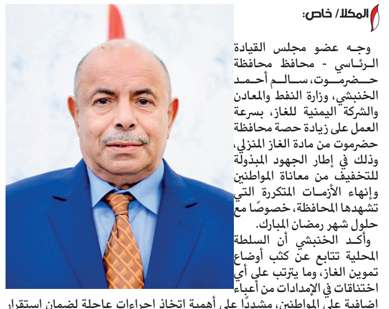
المكلا / خاص :

وجه عضو مجلس القيادة الرئاسي - محافظ محافظة حضرموت، سالم أحمد الخبثشي، وزارة النفط والمعادن والشركة اليمنية للغاز، بسرعة العمل على زيادة حصة محافظة حضرموت من مادة الغاز المنزلي، وذلك في إطار الجهود المبذولة للتخفيف من معاناة المواطنين وإنهاء الأزمات المتكررة التي تشهدها المحافظة، خصوصاً مع حلول شهر رمضان المبارك. وأكد الخبثشي أن السلطة المحلية تتابع عن كثب أوضاع تموين الغاز، وما يترتب على أي اختناقات في الإمدادات من أعباء إضافية على المواطنين، مشدداً على أهمية اتخاذ إجراءات عاجلة لضمان استقرار التموين وتغطية الاحتياج الفعلي لكافة مديريات المحافظة، بما يلبي احتياجات الأسر خلال الشهر الفضيل. وأشار عضو مجلس القيادة إلى أن حضرموت، بما تمثله من ثقل سكاني وجغرافي، تستحق حصة عادلة ومنظمة من الغاز المنزلي، بما يسهم في الحد من الأزمات ومنع أي ممارسات احتكارية تؤدي إلى رفع الأسعار أو خلق أزمات مصطنعة، لاسيما في المواسم التي تشهد زيادة في الاستهلاك.