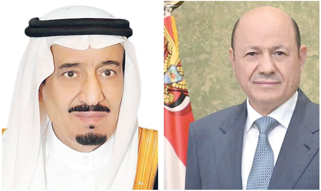
عدن / سبأ :

تبادل فخامة الرئيس الدكتور رشاد محمد العليمي رئيس مجلس القيادة الرئاسي، مع إخوانه ملوك، ورؤساء، وأمراء الدول العربية والإسلامية، التهاني والتبريكات بمناسبة حلول شهر رمضان المبارك. وأعرب رئيس مجلس القيادة في برقياته، باسمه وإخوانه أعضاء المجلس، عن أصدق تهانيه بهذه المناسبة