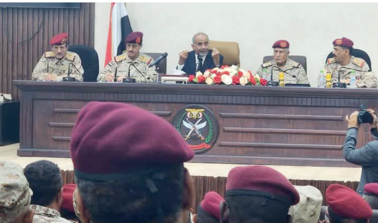
عدن / خاص :

العسكرية، وتعزيز الجاهزية الأمنية والعسكرية، بما يسهم في ترسيخ الاستقرار ورفع كفاءة الأداء المؤسسي للقوات المسلحة، وتوحيد الجهود لمواجهة التحديات الأمنية الراهنة. وأكد المشاركون أهمية التنسيق المشترك والعمل وفق رؤية موحدة تضمن تعزيز الأمن والاستقرار، ودعم مسار بناء مؤسسة عسكرية وطنية فاعلة تخضع لقيادة موحدة.