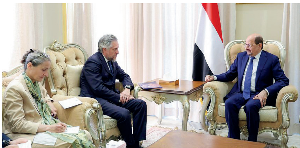
الرياض / سبأ :

أكد دولة رئيس مجلس الوزراء وزير الخارجية وشؤون المغتربين، الدكتور شائع محسن الزنداني، أن الحكومة سيكون لديها برنامج عملي قصير المدى حتى نهاية العام الجاري، يركز على الأولويات العاجلة بهدف استعادة ثقة المواطنين، والانتقال من إدارة الأزمة إلى إدارة الدولة. وأشار دولة رئيس الوزراء وزير الخارجية، خلال استقباله أمس رئيس بعثة الاتحاد الأوروبي لدى اليمن، السفير باتريك