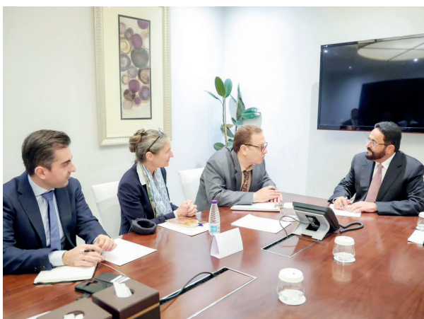
الرياض / سبأ :

التقى عضو مجلس القيادة الرئاسي، اللواء سلطان العرادة، أمس، سفير الاتحاد الأوروبي لدى اليمن، ليبحث مستجدات الأوضاع السياسية والاقتصادية والإنسانية، وسبل تعزيز العلاقات الثنائية، والتنسيق المشترك بين اليمن ودول الاتحاد الأوروبي في مختلف المجالات. وناقش اللقاء الذي حضره سفير بعثة الاتحاد الأوروبي لدى اليمن، باتريك سميونيه، وسفراء وممثلو فرنسا، وألمانيا، وهولندا، وأسبانيا، وإيطاليا، وبلجيكا، والسويد، والنمسا، والتشيك، والدنمارك، والمجر،