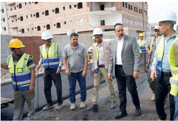
عدن / خاص :

دشن وزير الأشغال العامة والطرق المهندس حسين عوض العقربي، امس، أعمال الإسفلت في مشروع صيانة وإعادة تأهيل طريق التقنيّة إضاء (المرحلة الأولى) بمديرية المنصورة في العاصمة المؤقتة عدن، وتمويل وإشراف صندوق صيانة الطرق والجسور، وتنفيذ شركة الوالي للمقاولات العامة. وأكد الوزير العقربي أن الوزارة ستعمل وفق خطة عاجلة لإعادة تأهيل الطرق الحيوية وتحسين شبكة النقل في عدن والمحافظات الحرة والذي يأتي في إطار التوجه الحكومي لإعطاء أولوية قصوى لقطاع الطرق والبنية التحتية، مشدداً على أن تحسين البنية التحتية للطرق يمثل ركيزة أساسية لدعم التنمية وتحريك عجلة الاقتصاد وتخفيف معاناة المواطنين. وأشار العقربي إلى أن الوزارة تحرص على توجيه