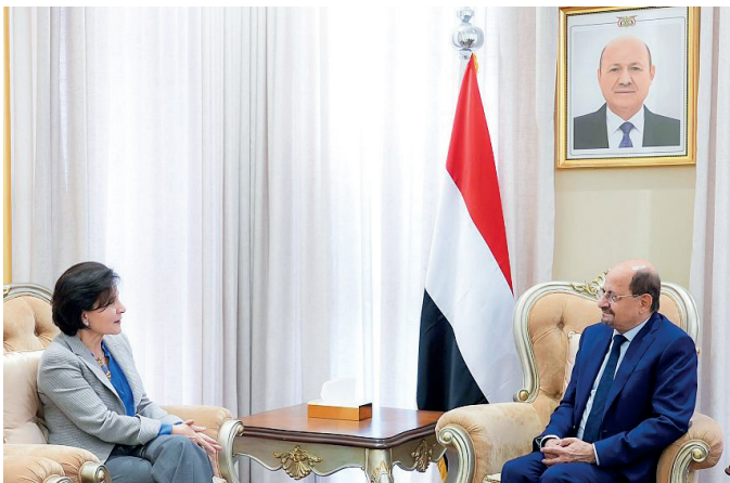
الرياض / سبأ :

التقى عضو مجلس القيادة الرئاسي محافظ حضرموت سالم الخنبري، سفيراً لمملكة هولندا لدى الجمهورية اليمنية، جانيث سيبين، لبحث مجالات التعاون والتدخلات التنموية المقدمة لمحافظة حضرموت والحفاظات المحررة، وسبل تعزيزها خلال المرحلة المقبلة. وخلال اللقاء، قدم عضو مجلس القيادة الخنبري عرضاً عن الوضع العام في