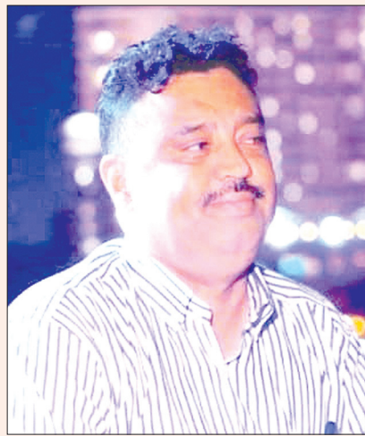
بقلم / نجيب الكماي

قريباً سيكون الكتاب متاحاً في معارض الكتب، ليصل إلى المهتمين والباحثين، وبشكل إضافي نوعية للمكتبة الأكاديمية العربية والدولية، ويثري النقاش العلمي حول الأمن الإقليمي والتحالفات الدولية.