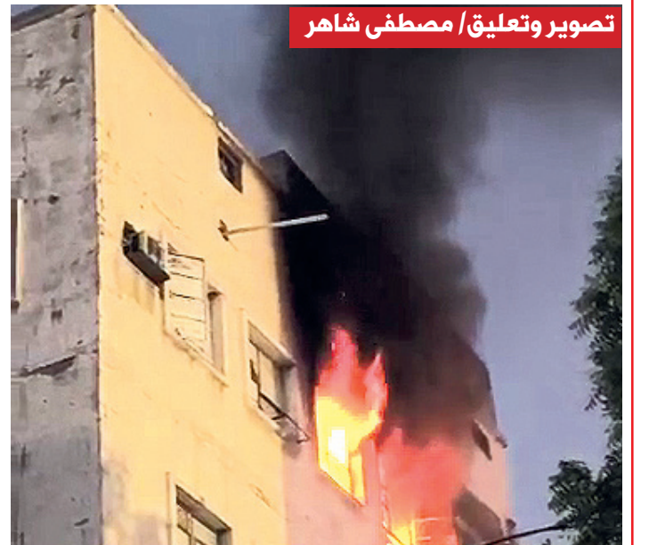
حريق في إحدى الشقق بالشارع الرئيسي بمديرية المعلا، والسبب بسيط (انفجار بطارية).. احذروا!

"أغيثوني بقطرة ماء..." ليست مبالغة في التعبير، بل هي صرخة حقيقية تنبع من قلوب أرهقتها العطش، وتخفقها أنابيب جافة وحفريات صامتة، نحن في عدن، المدينة التي تحتضن البحر، نموت من العطش، نعم، نموت ببطء، وكل يوم نخوض معركة البقاء بحثاً عن أبسط حقوق الإنسان: الماء. من كان يتخيل أن يصبح الماء أمينة ننتظرها كل خمسة أيام؟ من كان يظن أن نعيش يوم أكام الهيم نعد الساعات، نتربص صوت الماء، كأننا ننتظر معجزة؟ في بيوتنا خزانات صماء لا تمتلئ إلا الما، وصنابير لا تتسكب إلا الصمت، نساء يحملن أوعية من شارع إلى شارع، أطفال يبحتون عن قطرة، وشيوخ يتنهون من قهر الحاجة. كنا نعيش دون خزان، دون جدولة زمنية لوصول الماء، كانت المياه تملأ حنفياتنا بلا موعد، بلا وساطة،