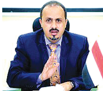
المزيد من النفاذ سيغني مزيداً من الفوضى والدمار، وسيؤدي إلى تداعيات أكبر يصعب احتواؤها لاحقاً.

رقعة أنشطتها التخريبية، ما يستدعي اتخاذ تدابير صارمة لردعها. وشدد الإيراني على أن الوقت قد حان لاتخاذ خطوات جادة وفعالة قبل أن تتفاقم الأزمة وتصعب التحديات أكثر تعقيداً، فمليشيا الحوثي ليست مجرد جماعة مسلحة محلية، بل تهديد دولي يستوجب موقفاً حاسماً. وختم الإيراني تصريحه بالتأكيد، أن الأمن والاستقرار في اليمن والمنطقة يتطلبان تعاوناً دولياً جاداً وإجراءات رادعة، وأن