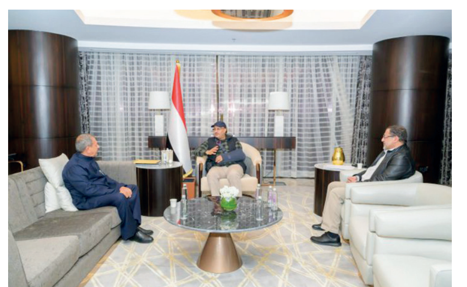
14 أكتوبر / خاص

أكد نائب رئيس مجلس القيادة الرئاسي - طارق صالح، الدور النضالي لأبناء محافظة إب قديماً وحديثاً في مواجهة الإمامة وأحفادها، والدفاع عن مكتسبات الثورة اليمنية الخالدة 26 سبتمبر. جاء ذلك خلال لقاء طارق صالح بمحافظ محافظة إب اللواء عبدالوهاب الوائلي، الذي أطلعته على الوضع الإنساني في مدينة إب ومديريات المحافظة في ظل الانتهاكات المتصاعدة من قبل مليشيا الحوثي الإرهابية المدعومة من النظام الإيراني.