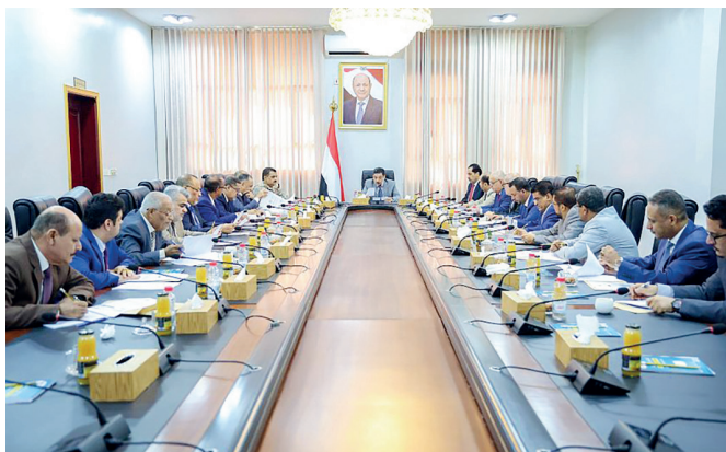
عدن / سبأ

أقر مجلس الوزراء في اجتماع استثنائي عقده الخميس الماضي برئاسة رئيس الوزراء الدكتور أحمد عوض بن مبارك، مشروع الخطة الاقتصادية الحكومية للأولويات العاجلة ومصروفاتها التنفيذية. وأكد المجلس في الاجتماع، المنعقد عبر الاتصال المرئي، وبمشاركة محافظ البنك المركزي اليمني، على استيعاب الملاحظات المقدمة من أعضاء المجلس حول الخطة بما يؤدي الى الاستجابة الحكومية الفاعلة لمواجهة التحديات الاقتصادية بمسؤولية وتخفيف التبعات الانسانية الكارثية التي صنعتها مليشيا الحوثي الارهابية المدعومة من ايران.. منوها بجهود اللجنة الوزارية المكلفة بإعداد الخطة برئاسة وزير المالية واللجنة الفنية ومراعاتها استيعاب المسارات الخمسة لأولويات