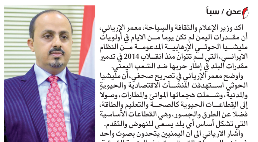
عدن / سبأ

أكد وزير الإعلام والثقافة والسياحة، معمر الإيراني، أن مقدرات اليمن لم تكن يوماً من الأيام في أولويات مليشيا الحوثي الإرهابية المدعومة من النظام الإيراني، التي لم تتوان منذ انقلاب 2014 في تدمير مقدرات البلد في إطار حربها ضد الشعب اليمني. وأوضح معمر الإيراني في تصريح صحفي، أن مليشيا الحوثي استهدفت المنشآت الاقتصادية والحيوية والمدنية، وشملت هجماتها الموانئ والمطارات، وصولاً إلى القطاعات الحيوية كالصحة والتعليم والطاقة، فضلاً عن الطرق والجسور، وهي القطاعات الأساسية التي تشكل أساس أي بلد يسعى للنهوض والتقدم. وأشار الإيراني إلى أن اليمنيين يتحدون بصوت واحد في رفض الهجمات التي تستهدف البنية التحتية، متناسلاً في الوقت ذاته: "من المسؤول عن استدعاء هذه الغارات إلى اليمن؟ والذي مارس تدميراً ممنهجاً لمقدراتها منذ عقد من الزمان، وبماذا يختلف استهداف الكيان الإسرائيلي لمطار صنعاء وقصف موانئ الحديدة، عن استهداف مليشيا الحوثي الإيرانية لمطار عدن الدولي، وموانئ عدن وشبوة وحضرموت؟". وقال الإيراني "إن مليشيا الحوثي الإرهابية استهدفت في 30 ديسمبر 2020 بالصواريخ الباليستية الإيرانية الصنع مطار عدن الدولي، مستهدفة طائرة مدنية كانت تقل الحكومة، ما أسفر عن مقتل 25 شخصاً وإصابة 110 آخرين، مع تعريض حياة آلاف اليمنيين الذين كانوا في استقبال الحكومة للخطر، وتدمير البنية الأساسية للمطار". وأضاف الإيراني "إن مليشيا الحوثي نفذت هجمات متتالية على الموانئ الرئيسية في المناطق المحررة، فهاجمت ميناء النشيمة النفطي وميناء رضوم باستخدام طائرات مسيرة إيرانية الصنع في 18 و19 أكتوبر 2022، كما استهدفت ميناء الضبة النفطي في مديرية الشحر في 21 أكتوبر 2022 بطائرتين مسيرتين، وفي 25 أكتوبر 2022، أغلقت