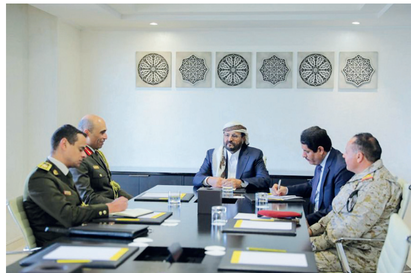
الرياض / سبأ

التقى نائب رئيس مجلس القيادة الرئاسي، اللواء سلطان العرادة، الملحق العسكري المصري، العميد الركن سامر شعبان، وبحث معه سبل تعزيز التعاون المشترك في المجالات العسكرية والأمنية. وناقش العرادة مع الملحق العسكري المصري، آخر التطورات والمستجدات الراهنة على الصعيدين الوطني والإقليمي في ظل استمرار تصعيد مليشيات الحوثي