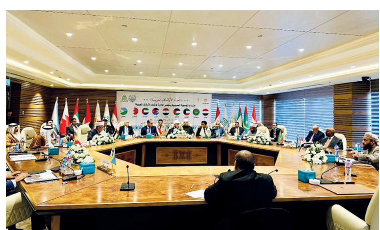
القاهرة / سبأ

الإسلامية وحاضرهما.. لافتاً إلى أن الاجتماع الجمعية العمومية ومجلس إدارة اتحاد الأوقاف العربية، المنعقد في العاصمة المصرية القاهرة بوفد ترأسه وزير الأوقاف والإرشاد، الدكتور محمد شيبية. وفي كلمته خلال الاجتماع، أكد الوزير شيبية أهمية الأوقاف الإسلامية التي تمثل ركيزة أساسية في تاريخ الأمة