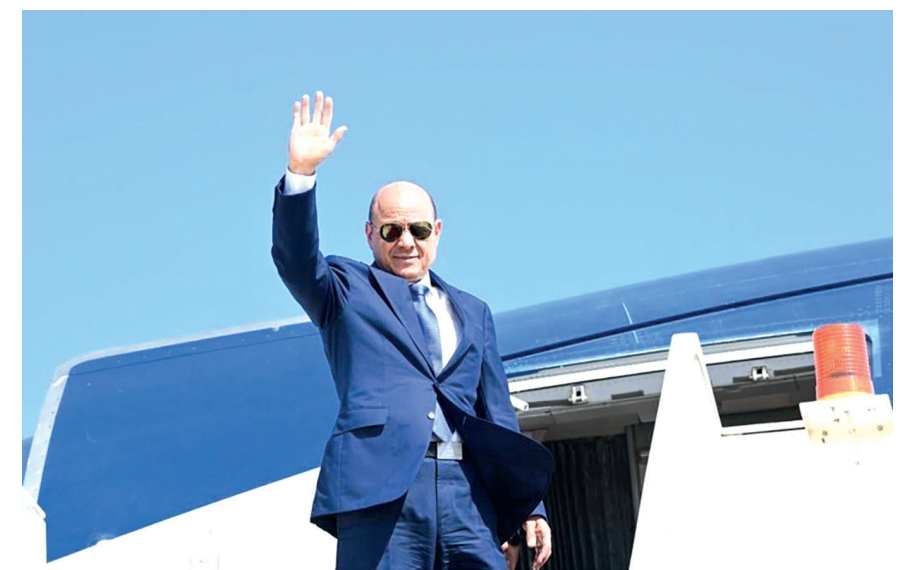
عدن / سبأ :

غادر الرئيس الدكتور رشاد محمد العليمي، رئيس مجلس القيادة الرئاسي، أمس العاصمة المؤقتة عدن، الى المملكة العربية السعودية في طريقه الى جمهورية مصر العربية بدعوة من اخيه فخامة الرئيس عبدالفتاح السيسي للمشاركة في المنتدى الحضري العالمي الذي تنطلق أعماله الأسبوع المقبل . وقال مصدر في مكتب رئاسة الجمهورية ان رئيس مجلس القيادة الرئاسي