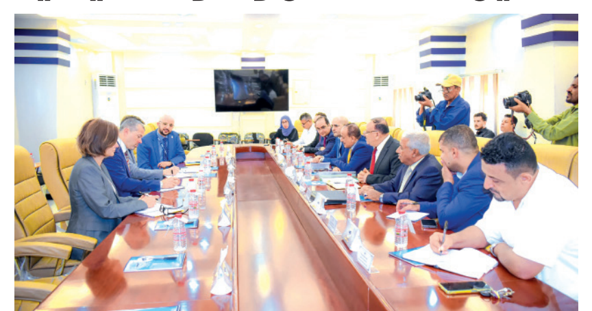
عدن / خاص :

استقبل وزير النقل الدكتور عبدالسلام صالح حميد، امس، بديوان عام الوزارة بالعاصمة عدن، الأمين العام للمنظمة البحرية الدولية السيد أرسينيو أنطونيو دومينجيز، والوفد المرافق له الذي يزور بلادنا لأول مرة. وجرى خلال اللقاء بحث جملة من المواضيع ذات الاهتمام المشترك وخاصة نتائج آثار ومترنات هجمات المليشيات الحوثية على السفن التجارية في البحر الأحمر ومضيق باب المندب وخليج عدن وانعكاساتها السلبية وعلى ارتفاع رسوم التأمين واجور الشحن البحري ومن ثم على اسعار وكلف السلع والخدمات موضحاً التحديات والصعوبات التي تواجه النقل البحري، كما تم بحث السبل الكفيلة