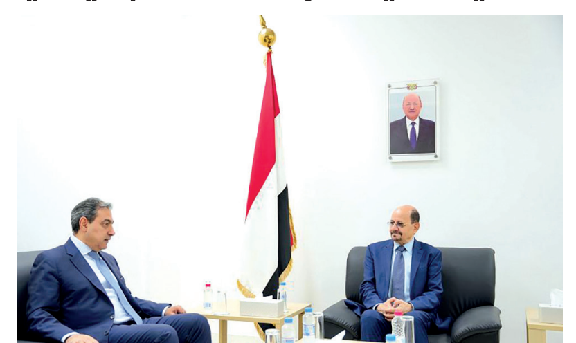
عدن / سبأ :

التقى وزير الخارجية وشؤون المغتربين الدكتور شائع الزنداني، أمس، نائب المبعوث الخاص للأمم المتحدة الى اليمن، سرحد فتاح . وجرى خلال اللقاء، مناقشة تطورات الأوضاع على الساحة الوطنية والمستجدات المتعلقة بتحركات المبعوث الخاص للدفع بجهود السلام في اليمن. كما تم، بحث السبل المتاحة لخفض التصعيد والتخفيف من معاناة الشعب اليمني. وأكد وزير الخارجية، على