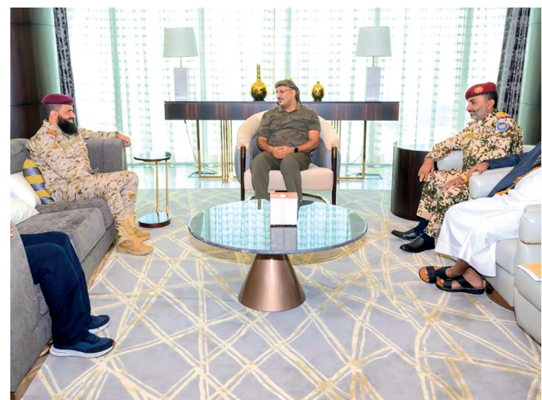
14 أكتوبر / خاص

وشدّد طارق صالح على رفع الجاهزية القتالية والحربية والاستعداد الجيد في كافة الجبهات من خلال تحضير كافة القوات والعتاد العسكري وتفعيل خطط الإسناد والبقاء في حالة تأهب دائم لأي خيارات واردة وأكد أن كافة الجبهات المقاومة للمشروع الحوثي تمثل مسرحاً حربياً واحداً للمحور.