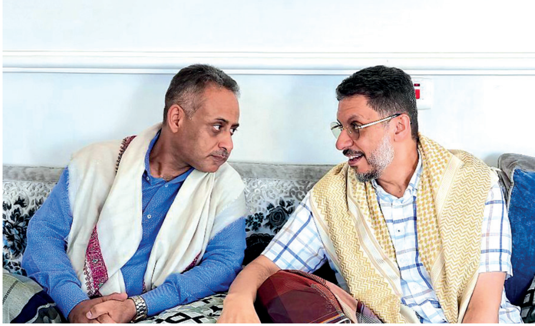
عدن / سبأ:

حضر رئيس الوزراء الدكتور أحمد عوض بن مبارك، مجلس العزاء الذي أقيم في العاصمة المؤقتة عدن، للمغفور لها بإذن الله تعالى والدة مستشار رئيس الوزراء السفير مجيب عثمان. وقدم دولة رئيس الوزراء السفير مجيب عثمان .. معرباً عن خالص التعازي وصادق المواساة بهذا المصاب. وأبتهل إلى الله العلي العظيم أن يتعمد الفقيدة بواسع رحمته وأن يسكنها فسيح جناته، وأن يلهم أهلها وذويها جميل الصبر والسلوان. في سياق آخر أعرب رئيس مجلس الوزراء الدكتور أحمد عوض بن مبارك، عن خالص التعازي