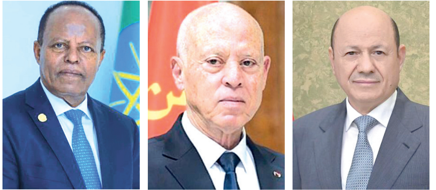
عدن / سبأ:

بعث الرئيس الدكتور رشاد محمد العلمي، رئيس مجلس القيادة الرئاسي، برقية تهنئة إلى أخيه الرئيس قيس سعيد، رئيس الجمهورية التونسية، بمناسبة فوزه بولاية رئاسية جديدة. وأعرب رئيس مجلس القيادة، باسمه وباسم نواب رئيس المجلس، والحكومة، عن خالص التهاني، وأطيب التمنيات للرئيس قيس سعيد بموفور الصحة والسعادة، ولحكومة وشعب الجمهورية التونسية التقدم والازدهار، وللعلاقات الثنائية بين البلدين الشقيقين التطور والنماء في مختلف المجالات. وأشاد الرئيس، بالواقف الاخوية الثابتة للجمهورية التونسية قيادة وحكومة وشعباً، إلى جانب اليمن وقيادته السياسية، ونظامه الجمهوري، واستعادة مؤسسات الدولة، وإنهاء انقلاب الميليشيات الحوثية المدعومة من النظام الإيراني. كما بعث الرئيس الدكتور رشاد محمد العلمي، رئيس مجلس القيادة الرئاسي، برقية تهنئة إلى فخامة الرئيس تاي أتسكي سيلاسي، هناك فيها بمناسبة انتخابه رئيساً لجمهورية إثيوبيا الفدرالية الديمقراطية. وأعرب رئيس مجلس القيادة الرئاسي، باسمه وباسم نواب رئيس المجلس والحكومة عن خالص تهانيه للرئيس سيلاسي بانتخابه رئيساً لبلاده، وتمنياته له بموفور الصحة والسعادة، والتوفيق والسداد في مهامه الجديدة، وللشعب الإثيوبي الصديق كل التقدم والرخاء.