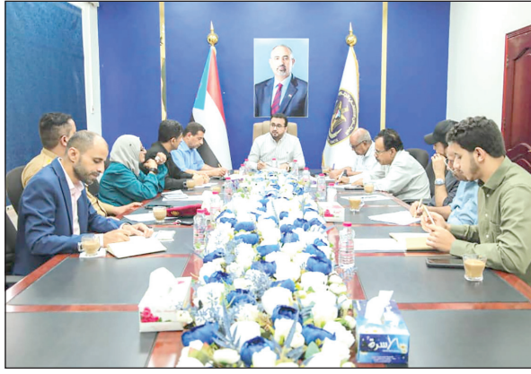
وحدة أبناء الجنوب والتفافهم الواعي حول قضيتهم وقواتهم المسلحة في جبهات القتال مع

الحوثيين وفي ميادين تثبيت الأمن والاستقرار ومكافحة الإرهاب. ودعت الهيئة الوطنية للإعلام الجنوبي كافة المؤسسات والأقلام الوطنية إلى التنبيه من الخطاب الإعلامي المعادي الذي يحرض ضد الأمن والاستقرار ويهدف لتعكير صفو السلم المجتمعي، والإسهام في اطلاع الرأي العام على المستجدات والحقائق والمعلومات بموضوعية ومهنية. ووقفت الهيئة أمام عدد من القضايا الإعلامية المطروحة واتخذت بشأنها عدداً من الإجراءات.