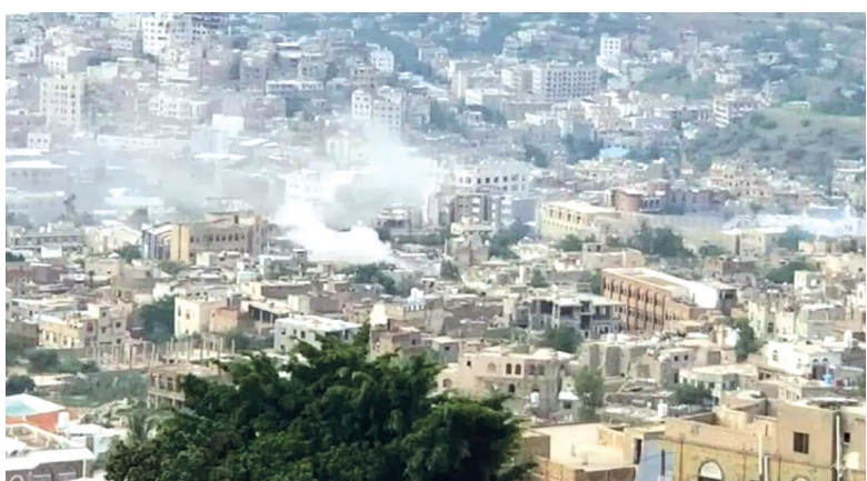
واشنطن / سبأ

كشفت المركز الأمريكي للعدالة (ACJ)، ان مليشيات الحوثي الارهابية المدعومة من النظام الإيراني، تسببت في مقتل (3021) مدنيا وإصابة (6361) آخرين بينهم نساء واطفال بمحافظة تعز نتيجة القنص، والقصف المباشر للمدنية، وزراعة الألغام وذلك خلال الفترة من مارس 2015م حتى ديسمبر 2023م. (9) أعوام والآثار والتداعيات وأوضح المركز في تقرير له بعنوان