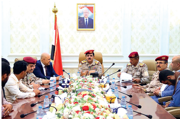
عدن / سبأ

أشاد وزير الدفاع الفريق الركن محسن الداعري بالدور المحوري لمحافظة تعز وصلابة جبهاتها في مواجهة مليشيا الحوثي الإرهابية المدعومة من النظام الإيراني وما قدمته من تضحيات جسيمة وصمود اسطوري خلال سنوات الحرب مع هذه المليشيا. جاء ذلك خلال لقائه امس محافظ محافظة تعز نبيل شمسان وأركان حرب محور تعز اللواء عبدالعزيز المجيدي وممثلي أسر الشهداء والجرحى، بحضور نائب رئيس هيئة الأركان العامة اللواء الركن احمد البصر لمناقشة أوضاع المحور والشهداء والجرحى من منتسبيه على وجه الخصوص. وأكد الفريق الداعري أولوية ملف الشهداء والجرحى وحصر قيادة وزارة الدفاع على معالجة ورعاية الجرحى والاهتمام بأسر شهداء القوات المسلحة باعتبار ذلك