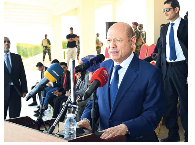
المكلا / سبأ

اعلن الرئيس الدكتور رشاد محمد العلمي، رئيس مجلس القيادة الرئاسي امس، البدء بالاجراءات اللازمة لإنشاء محطتين للطاقة الكهربائية في محافظة حضرموت بقدرة 100 ميغاوات. وقال رئيس مجلس القيادة في كلمة له بمقر كلية الشرطة بحضور نائب رئيس المجلس الدكتور عبدالله العلمي، والشيخ عثمان مجلي، أن المشروع الذي ستقاسم تمويله الحكومة، مع السلطة المحلية، يشمل إنشاء محطة للكهرباء في حضرموت الساحل، وأخرى في الوادي بقدرة 50 ميغاوات لكل منهما. وأشاد الرئيس قبيل مغادرته وعضوي المجلس امس الاحد مدينة المكلا بالانجازات التي تتحقق لبناء حضرموت، رغم الظروف التمويلية الصعبة التي فاقمتها الهجمات الارهابية للمليشيات الحوثية المدعومة من النظام الإيراني على المنشآت النفطية، وسفن الشحن البحري، وخطوط الملاحة الدولية. ودعا فخامة الرئيس، لطالب انشاء حضرموت السياسية، والمدنية، والاجتماعية الى تعزيز هذه الانجازات بمزيد من التلاحم ووحد الصنف لما فيه خير، ونماء المحافظة، واستقرارها باعتبارها قاطرة للتنمية، واستعادة مؤسسات الدولة. واكد رئيس مجلس القيادة، تفهم المجلس والحكومة لمطالب انشاء حضرموت المشروعة، والعمل على تبنيها وتنفيذها بالشراكة مع كافة مؤسسات الدولة. ولبحث عبد الله التميمي، لبحث مستجدات الاوضاع في المحافظات الشرقية حضرموت وشبوة والمهرة وسقطرى وجهودهم الوطنية.