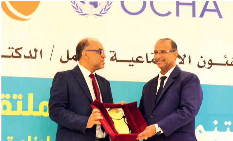
عدن / خاص

أكد وزير الشؤون الاجتماعية والعمل، الدكتور محمد سعيد الزعوري، على أهمية تطوير وبناء مؤسسات المجتمع المدني للإسهام في تحسين أوضاعها وزيادة تأثيرها الإيجابي ووضع خطط لضمان استدامة النتائج المحققة. وأوضح الوزير لدى تدشينه امس، بالعاصمة عدن، ملتقى استدامة 2024 لبناء قدرات منظمات المجتمع المدني الأهمية التي يكتسبها الملتقى الذي تقيمه مؤسسة التواصل للتنمية الإنسانية من حيث أنه يشمل عددا من البرامج التدريبية وورش العمل في مجال القيادة والحوكمة واستخدام تطبيقات الهاتف المحمول في العمل الإنساني بهدف تحسين قدرات قيادات تلك المنظمات لتحقيق الكفاءة والفعالية المطلوبة في قيادة منظماتهم. ولفت الوزير الزعوري الى أهمية التعاون المشترك الذي تقيمه الوزارة مع