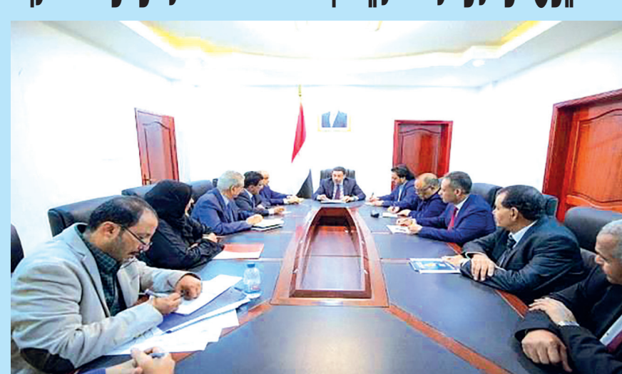
عدن / سبأ

كشفت وزارة الكهرباء والطاقة، عن تحقيق وفر مالي كبير في تكلفة شراء الوقود ونقله من وإلى جميع المحافظات المحررة، مما ساهم بشكل ملموس في تقليل الأعباء المالية على الحكومة، وتحسين كفاءة عمليات توليد الكهرباء وتعزيز الخدمة المقدمة للمواطنين، منذ تشكيل لجنة مناقصات لشراء وقود محطات توليد الكهرباء، بموجب قرار دولة رئيس مجلس الوزراء الدكتور أحمد عوض بن مبارك رقم (20) لسنة 2024م، ضمن نهج الحكومة لتعزيز مبدأ الشفافية وحوكمة الإجراءات. وأظهر تقرير صادر عن الوزارة، أن الإجراءات التي اتخذتها لجنة المناقصات، حققت منذ مباشرة عملها وفرًا ماليًا كبيرًا في كلفة الوقود والنقل، مما ساهم في تقليل الأعباء