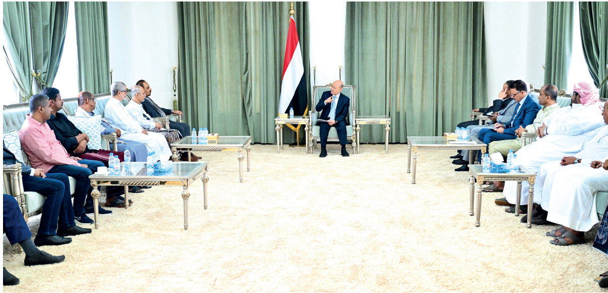
المكلا / سبأ

أكد رئيس مجلس القيادة الرئاسي أهمية اللقاء بقيادة الغرفة التجارية والصناعية بمحافظة حضرموت، منوهاً بجهودهم وتدخلاتهم الإنسانية والانمائية في ظل ظروف الحرب الظلمة التي أشعلتها الميليشيات الحوثية الإرهابية بدعم من النظام الإيراني.