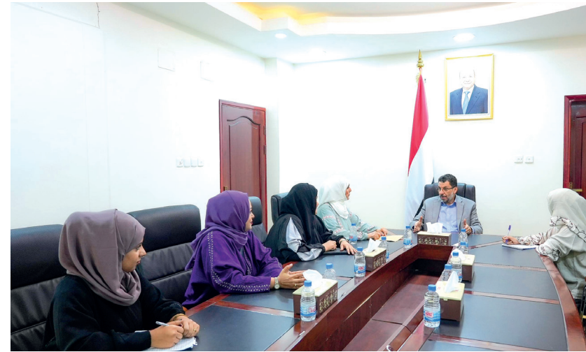
عدن / سبأ

جدد رئيس مجلس الوزراء الدكتور أحمد عوض بن مبارك، التزام الحكومة بتمكين المرأة من المشاركة الفاعلة في كافة مجالات الحياة، وتعزيز حضورها في مواقع صناعة القرار، ومساندة قضاياها على مختلف المستويات. وأشاد دولة رئيس الوزراء خلال لقائه، أمس، في العاصمة المؤقتة عدن، رئيسة