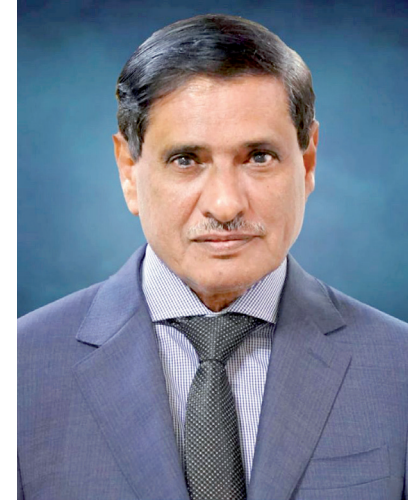
عدن / سبأ