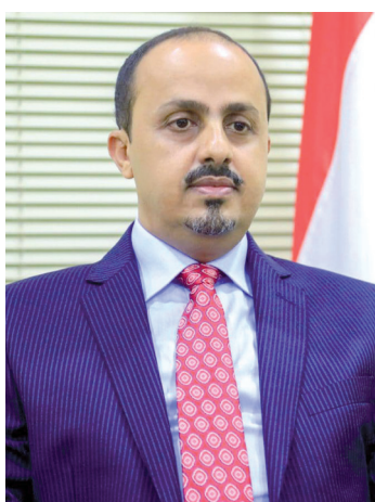
عدن / سبأ

قال وزير الإعلام والثقافة والسياحة، معمر الإيراني "إن مليشيا الحوثي الإرهابية التابعة لإيران، تحاول اصطناع بطولات وهمية والترويج للانتصارات زائفة، منذ إعلان المبعوث الأممي الخاص إلى اليمن، هانس غرونبرغ عن اتفاق الحكومة الشرعية والمليشيات، على عدة تدابير لخفض التصعيد فيما يتعلق بالقطاع المصرفي والخطوط الجوية اليمنية. وأوضح معمر الإيراني في تصريح صحفي، إن الإجراءات التي كان البنك المركزي اليمني قد اتخذها في إبريل المنصرم، تمثلت في جوهرياً تحريك الأوراق لضغط على الميليشيا الحوثية لوقف ممارساتها التدميرية بحق القطاع المصرفي والمالي، والحد من التداعيات الكارثية لتوقف الصادرات النفطية على الاقتصاد والعملية الوطنية، وتحسين الظروف المعيشية للمواطنين في مختلف أنحاء الوطن.