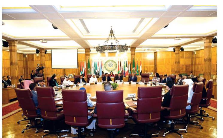
عدن / سبأ

ناقش وزير التعليم العالي والبحث العلمي والتعليم الفني والتدريب المهني الدكتور خالد الوصابي، أمس، في العاصمة المؤقتة عدن، آليات تطوير قطاع التعليم الفني. وأكد الوزير الوصابي خلال الاجتماع الذي ضم نائب وزير التعليم الفني والتدريب المهني عبدربه المحولي، وكلاء الوزارة، على أهمية توحيد الجهود مع كافة الشركاء المحليين والدوليين لارتقاء بمستوى التعليم الفني في جميع