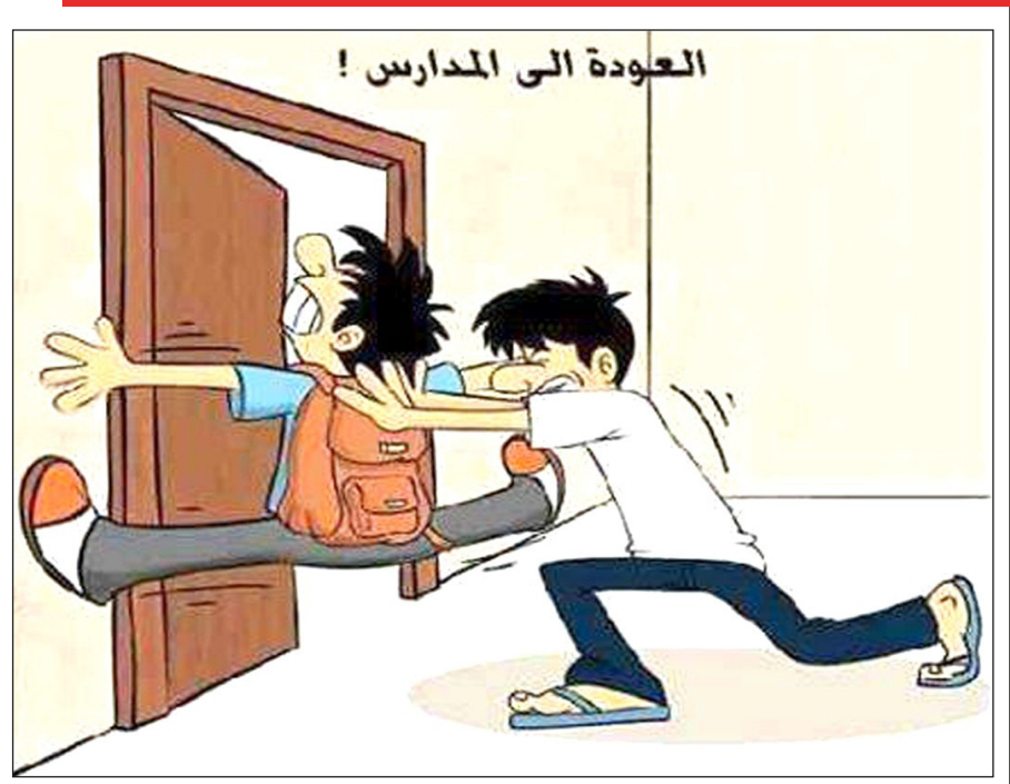
العودة الى المدارس !