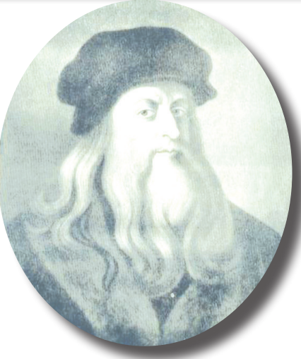
الرسام العالمي ليوناردو ديفانشي

انظر إلى الشارع مع الغروب، وجوه الرجال والنساء ياللقداسة يا لل00000.قداسة. عقل الفنان يتحول إلى مرآة تتخذ دوما لون الشيء المنعكس عليها وتستوعب من الصور بعدد الأشياء الموضوعة أمامها . الرسم شيء ذهني ! إذا كنت وحيدا فسوف تكون مع نفسك