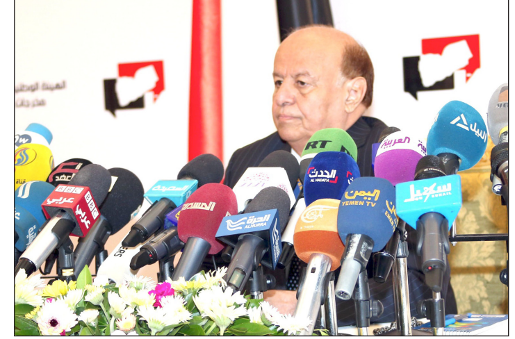
رئيس الجمهورية خلال ترؤسه الاجتماع أمس

الذين استشهدوا في حضرموت وفي كل ربوع الوطن والذين بذلوا أرواحهم ودماءهم الغالية دفاعاً عن أمن الوطن واستقراره، واتعهد بأن دماهم لن تذهب هدراً وبأن المجرمين الذين ارتكبوا تلك الجرائم سينالون جزاءهم العادل قريباً.. وأضاف قائلاً: لقد أكدنا مراراً أن استخدام العنف والسلاح لا يمكن أن يحقق أي هدف سياسي خارج عن الإجماع الوطني المتمثل في مخرجات الحوار الوطني الشامل فضلاً عن أنه عمل طائش وأرعن مبدان على المستوى الوطني والإقليمي والدولي..