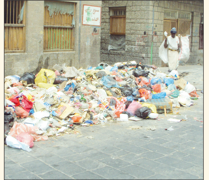
تصوير وتعليق / عادل خدشي

تتكون هذه القمامة في المنطقة في الواقعة في حارة الشريف بمديرية صيرة في كريتير بجانب سوق الذهب. مازلتنا كلما مررنا في بعض شوارع مدينة كريتير نشاهد مثل هذه الصور المسيئة لمكانة المدينة وسكانها، فماداً يا ترى انتم فاعلون يا مدير مديرية صيرة؟!..