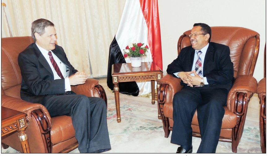
بن دغر لدى لقائه السفير الأمريكي أمس

ناقش نائب رئيس الوزراء وزير الاتصالات وتقنية المعلومات الدكتور أحمد عبيد بن دغر أمس مع سفير الولايات المتحدة الأمريكية لدى اليمن ماثيو تولر الجوانب المتعلقة بتعزيز آفاق التعاون الثنائي بين البلدين والشعبين الصديقين في مختلف المجالات. وتطرق اللقاء إلى الأوضاع الراهنة في البلاد وسبل دعم التسوية السياسية بقيادة الأخ الرئيس عبدربه منصور هادي رئيس الجمهورية وحكومة الوفاق الوطني بما يخدم الآفاق المستقبلية ليمن مزدهر وأمن. وأكد نائب رئيس الوزراء وزير الاتصالات خلال اللقاء حرص الحكومة على الارتقاء بمستوى العلاقات اليمينية الأمريكية.. داعياً الشركات الأمريكية للدخول في سوق الاتصالات اليمينية وذلك بهدف توطين التكنولوجيات الحديثة والاستفادة من الخبرات الأمريكية في هذا المجال. وتمن بن دغر الدور المتميز الذي تقوم به الولايات المتحدة في سبيل إخراج اليمن من محنته السياسية والاقتصادية ودعم آليات تنفيذ المبادرة الخليجية وإنجاح المرحلة الانتقالية. بدوره أكد السفير الأمريكي استمرار دعم بلاده للجهود اليمينية وبما يساهم في تحقيق الاستقرار الأمني والاقتصادي الذي يحتاجه الشعب اليمني في ظل الظروف الراهنة.