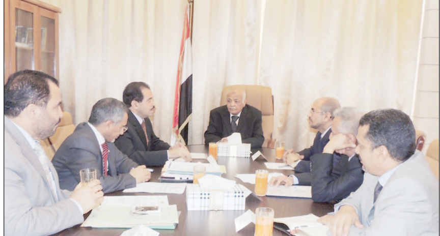
ياسندوه يترأس اجتماع المجلس الأعلى للطاقة

تقليل الاعتماد على وقود الديزل في توليد الكهرباء، نظرا لكلفته العالية، فضلا عن الجوانب المرتبطة بتحويل الموارد ورفع كفاءة الأداء، لما يمثله من أهمية في استقرار وتطوير الخدمة الكهربائية. وأقر المجلس الأعلى للطاقة تشكيل لجنة فنية لمساعدة المجلس في وضع الرؤى والمقترحات والبدائل اللازمة للتعامل مع الطاقة الكهربائية بشكل استراتيجي تحت إشراف نائب رئيس الوزراء وزير الكهرباء وبمشاركة ممثلين عن الوزارات والجهات المعنية.. مؤكدا أهمية