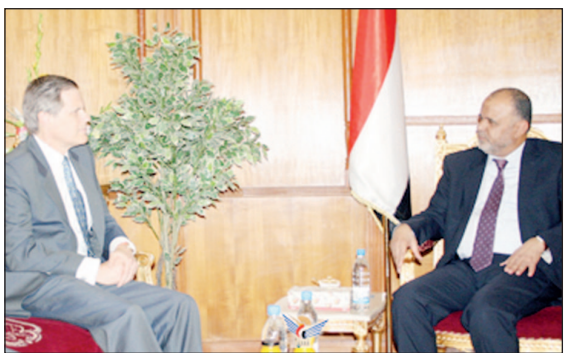
رئيس اللجنة العليا للانتخابات يلتقي السفير الأمريكي

الانتخابي الإلكتروني الذي سيتم في أربع مراحل. بدوره أكد سفير الولايات المتحدة الأمريكية أن بلاده ستواصل تقديم كافة أوجه الدعم لإنجاح مهام وأنشطة اللجنة العليا للانتخابات، مشيرا إلى أن المجتمع الدولي حريص على دعم وإنجاح المرحلة الانتقالية في اليمن. وقد أشاد السفير الأمريكي بالخطوات التي اتخذتها لجنة الانتخابات والتي وصفها بالناجحة، وكذا بطريقة تعاملها للمعمل المستقبلي، لافتا إلى أن جميع اليمنيين يتطلعون إلى المهام التي ستفرضاها اللجنة. وفي السياق ذاته زار سفير الولايات المتحدة الأمريكية ومعه رئيس اللجنة ونائب رئيس اللجنة مركز المعلومات التابع لمشروع السجل الانتخابي الإلكتروني. في سبيل البدء بتنفيذ التسجيل