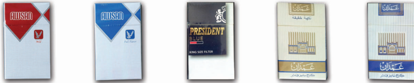
أوسان أزرق وأحمر

تعلن الشركة المتحدة للصناعات (ش.م.م) بأن أسعار منتجاتها من سجائر غمدان بنوعيهما (أزرق وأبيض) وكذلك برزدنت وأوسان بنوعيهما (أزرق وأحمر) كالتالي :-