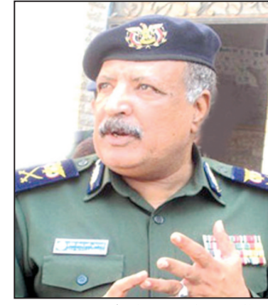
اللواء / علي ناصر لخشع

بالعاصمة وعدم استجابتهم للقيام بمظاهرات كما توهبوا قيامها لان المواطنين يعرفون حق المعرفة من يقف وراء هذه الدعوات واهدافها . أكد نائب وزير الداخلية ان الوضع الأمني عاد الى طبيعته في اليوم نفسه واجهزة