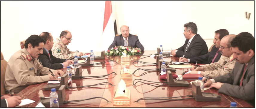
.. ويستقبل رئيس وأعضاء اللجنة الأمنية العليا

استقبل الأخ الرئيس عبد ربه منصور هادي رئيس الجمهورية أمس بمكتبه بدار الرئاسة رئيس وأعضاء اللجنة الأمنية العليا . وجرى خلال اللقاء مناقشة طبيعة الأوضاع الأمنية الراهنة وأعمال شغب