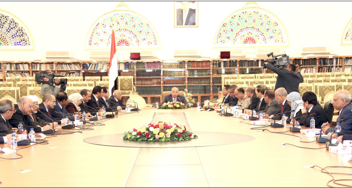
رئيس الجمهورية لدى ترؤسه الاجتماع الاستثنائي للحكومة

وملاحقة العناصر الإرهابية حتى يتم تطهير الأرض التي تطلها من شورها وإرهاها . وفي الاجتماع عبر الأخ رئيس الوزراء محمد سالم باسندوة عن ترحيبه وتقديره للأخ الرئيس . مؤكداً أن المصلحة الوطنية العليا يجب أن تكون هي الأداء الأساسي في برنامج الوزراء بعيداً عن الولاء الحزبي أو الجهوي أيا كان باعتبار مصلحة الوطن فوق كل الاعتبارات الأخرى. وتحدث الأخ رئيس الوزراء عن أزمة المشتقات النفطية وأكد أن هناك كميات كبيرة تصل إلى العاصمة تفوق الحاجة المعروفة إلا أن هناك تسريباً متعمداً قد يرتكبه البعض من أجل السوق السوداء والكسب الرخيص .. مشيراً إلى ضرورة أن تكون هناك لجنة مشكلة من الجهات المعنية وأمين العاصمة أو من يراه للنزول إلى المحطات والتفتيش عن طبيعة الأداء والاستهلاك والكشف عن أي مخالفات. حضر الاجتماع مدير مكتب رئاسة الجمهورية الدكتور أحمد عوض بن مبارك وأمين عام رئاسة الجمهورية الدكتور منصور البطاني .