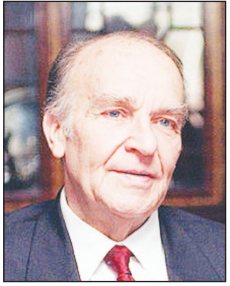
علي عزت بيجوفيتش

"حامل الثقافة هو الإنسان، وحامل الحضارة هو المجتمع، ومعنى الثقافة القوة الذاتية التي تكتسب بالتنشئة. أما الحضارة فهي قوة على الطبيعة عن طريق العلم، فالعلم والتكنولوجيا والمدن كلها تنتمي إلى الحضارة. وسائل الثقافة هي الفكر واللغة والكتابة. وكل من الثقافة والحضارة ينتمي أحدهما إلى الآخر كما ينتمي عالم السماء إلى هذا العالم الدنيوي، أحدهما (دراما) والآخر (طوبيا)، الحضارة تعلم، أما الثقافة تنور، تحتاج الأولى إلى تعلم، أما الثانية فتحتاج إلى تأمل".