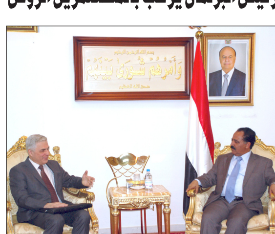
صنعا / سبأ :

أكد رئيس مجلس النواب يحيى الراعي أهمية تعزيز علاقات التعاون والصداقة بين اليمن وروسيا .