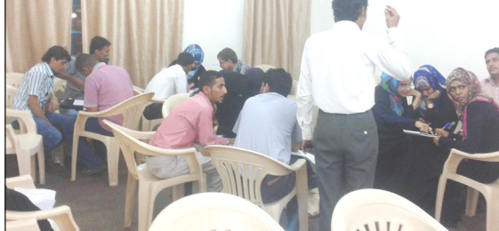
عدن / علاء بدر:

اختتمت يوم أمس الخميس 29 / 5 / 2014م في مركز نوسكيلز للتدريب والتطوير بمحافظة عدن أعمال الدورة التدريبية التي كانت بعنوان: ( القيادة الإدارية )، والتي نظمتها مؤسسة القائد للتنمية والتدريب لمدة خمسة أيام، بعدد أربع ساعات كل يوم.