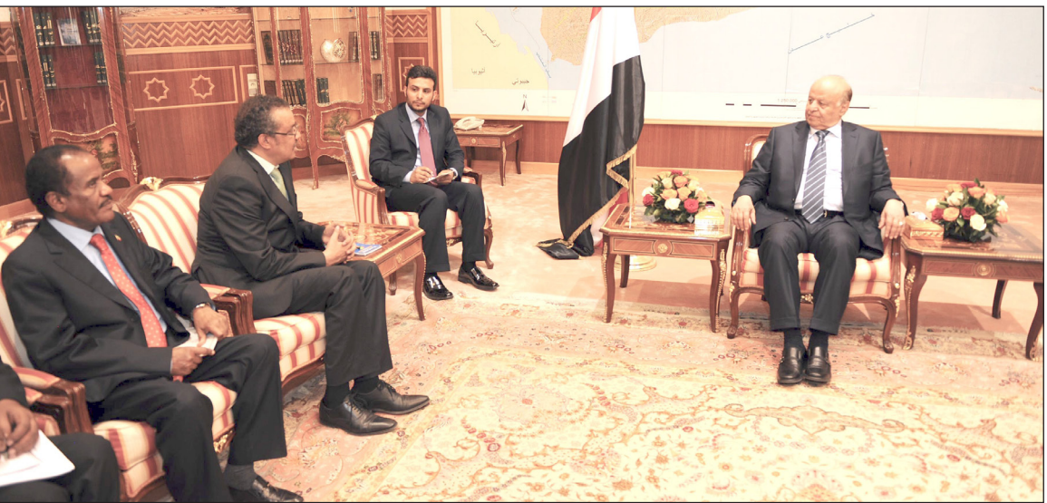
الرئيس خلال استقباله وزير الخارجية الإثيوبي أمس

وفي اللقاء أكد الأخ الرئيس الجمهورية على عمق العلاقات التاريخية والمتينة بين اليمن وإثيوبيا.. مشيداً بدور إثيوبيا ومكانتها وعلاقتها المتوازنة والمتميزة في المنطقة والقارة الأفريقية. وأشار الأخ الرئيس إلى العلاقات والتعاون الطويل بين البلدين والذي نتطلع اليوم إلى تعزيزه وتفعيله في المجالات الاقتصادية والتجارية والمدنية التاريخية والتي تزخر بها اليمن وفي المقدمة الأمنية باعتبارها متطلبات المرحلة.. مؤكداً على ضرورة تفعيل التعاون والتبادل التجاري بين الغرف التجارية في 6