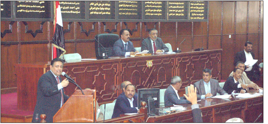
من جلسات مجلس النواب

أوضح رئيس مجلس النواب الأخ يحيى الراعي في مستهل أعمال جلسة مجلس النواب أمس أن المجلس ظل يقف من خلال أعماله التشريعية والرقابية أمام مسؤوليته الدستورية والقانونية الوطنية والتاريخية في ظل ظروف مختلفة تعيشها بلادنا. وأكد الانحياز الدائم إلى الشعب والوطن... وبين رئيس مجلس النواب أن الشعب هو من يتحمل تبعات المشكلات الاقتصادية والأمنية التي تمر بها البلاد وهو من يتكبد ويلات تلك المشاكل التي تعصف بحياة اليمنيين وهو من يعاني من انقطاع