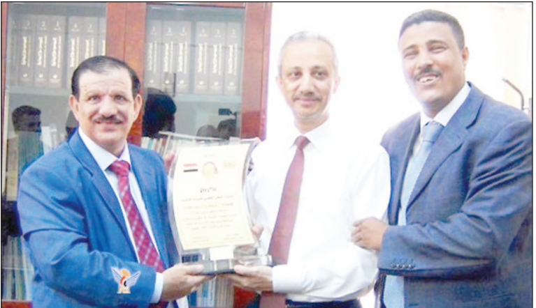
تعز / نعانم خالد: كرم الملتقى الوطني لشباب الوحدة من محافظة عدن أمس محافظ محافظة تعز شوقي احمد هائل رئيس المجلس المحلي بدرع الملتقى لدوره البطولي وتحمله كل التحديات التي كانت تعاني منها المحافظة خلال المرحلة المتعاقبة والرائحة وصعوبتها ولقيادته الحكيمة لمحافظة النخافة . وفي مراسم التكريم الذي حضره وكيل محافظة تعز عبد الله أحمد أمير عبير المحافظ شوقي هائل عن تقديره وسعادته بهذا التكريم بدرع غال على قلوب اليمنيين وهو يحمل شعار الملتقى الوطني لشباب الوحدة . وهذا المحافظ رئيس الجمهورية عبدربه منصور هادي بمناسبة قدوم العيد الوطني للوحدة اليمنية المباركة والانتصارات المتلاحقة التي يجسدها أبطال القوات المسلحة والأمن واللجان الشعبية في عدد من محافظات الجمهورية ضد قوى الشر والعدوان . وأكد رئيس الوفد القادم من محافظة