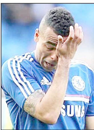
بالانتقال إلى كل من ريال مدريد الإسباني ونورويتش ريد بولز الأميركي في الصيف المقبل.

والتقطت عدسات الكاميرات أكثر من صورة لكول وهو يعانق زميله فرانك لامبارد وقائد الفريق جون تيري مما أثار تساؤلات الجميع حول ما إذا كانت هذه المباراة هي الختامية للظهير الإنجليزي على أرضية ملعب ستامفورد بريدج. ويرتبط اللاعب صاحب الـ 34 عاماً،