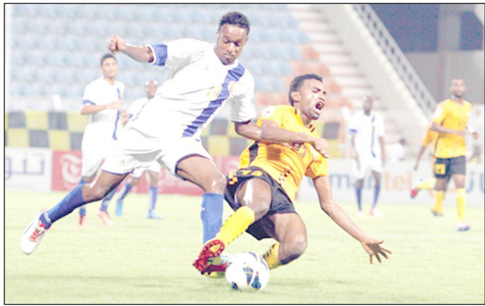
النصر والنهضة سيحتضن المباراة النهائية المقررة في 18 الجاري أيضا. وسينال الفائز باللقب مكافأة مالية قدرها 400 ألف دولار، مقابل 250 ألفا للوصيف.