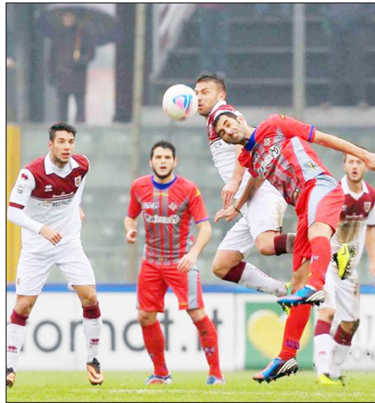
تشرين الثاني الماضي عقب إجراء نوتشرينا للتغييرات الثلاثة المسموح بها في أول دقيقتين قبل أن يصاب خمسة من لاعبيه في العشرين دقيقة التالية مما ترك الفريق يلعب بستة لاعبين وهو عدد أقل من المسموح به وهو سبعة لاعبين في الملعب.

وابتليت دوريات الدرجات الأقل في ايطاليا بافضاح والمشكلات المالية وأعمال الشغب. وفي فبراير شباط الماضي سجل فريق