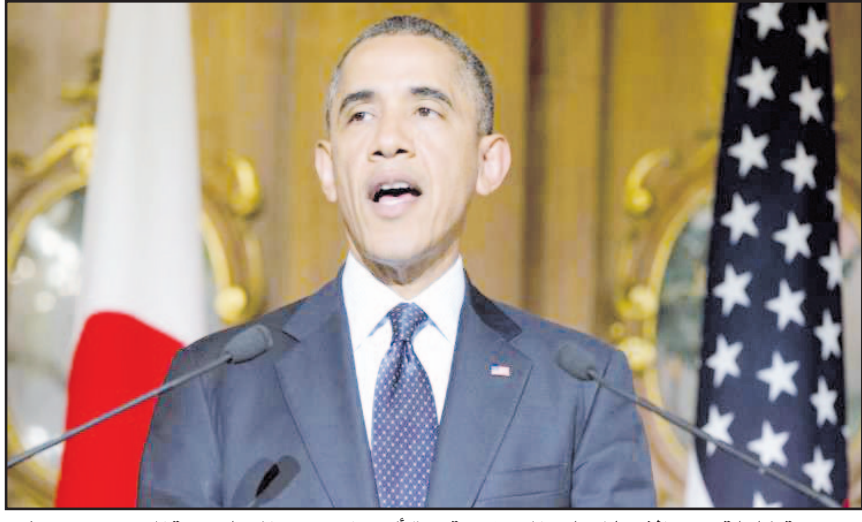
مجموعة كاملة من الإصلاحات الدستورية المنسجمة مع ما تمت مناقشته.

وأوضح أوباما -الذي يزور طوكيو بالمحطة الأولى من جولة آسيوية تشمل أربع دول- أنه كان متشائما منذ البداية بشأن التزام موسكو بما سيتم الاتفاق عليه بين جنيف، مقابل ما اعتبره اتخاذ كيبف خطوات عملية "تطرح