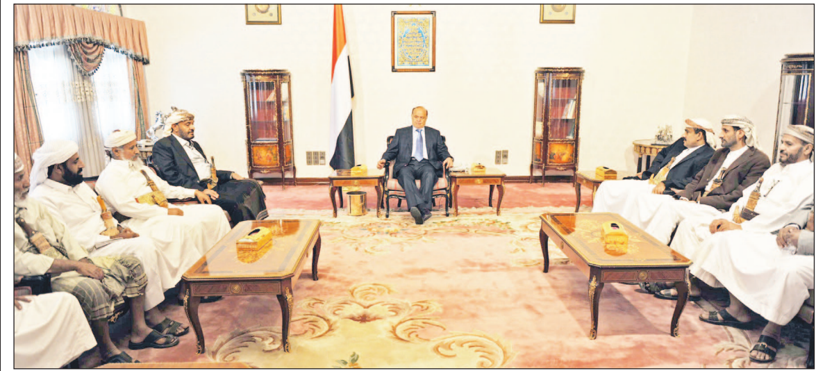
رئيس الجمهورية لدى استقباله مشايخ وأعيان محافظة شبوة أمس

بالكثير مما يجري هنا وهناك، مؤكداً أن عملية التغيير وفقاً للتسوية السياسية المرتكزة على المبادرة الخليجية واليتها التنفيذية المزمرة تمضي بصورة طيبة. وأشار الأخ الرئيس إلى أنه على اطلاع