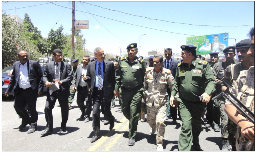
وزير الداخلية خلال زيارته لمركز شرطة عصيفرة والثورة وباب موسى بتعز

أجرى وزير الداخلية اللواء عبده حسين الترب أمس وضمن زيارته لمحافظة تعز عملية نزول مفاجئة لعدد من مراكز وأقسام الشرطة بمحافظة للتعرف على سير العمل فيها ومعرفة الاختلالات عن قرب. وشملت تلك الزيارات مراكز شرطة عصيفرة والثورة وباب موسى، واستمع من المعنيين والمشاكل والعوقات التي تواجه العمل الشرطي في تلك المراكز، كما استمع إلى آراء عدد من المواطنين وملاحظاتهم حول العمل الأمني والخدمات التي تقدمها تلك المراكز وكيفية تحسين الأداء فيها. وجه وزير الداخلية المعنيين إلى تقاضي السلبات والعمل بجدية ونزاهة أثناء تقديم الخدمات، والقرب من المواطنين وإشراكهم ليكونوا عوناً لرجال الأمن في مختلف الظروف. كما وقف وزير الداخلية على قضايا الموقوفين في أماكن الاحتجاز واستمع إلى همومهم ومشاكلهم ووجه المعنيين بسرعة إنجاز قضاياهم وحالتهم للجهات المعنية دون تأخير. وجه بإستئجار مبنى بديل لمركز شرطة الثورة بتعز نظراً لضيق مساحة المركز الحالي.