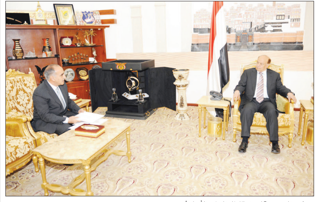
رئيس الجمهورية لدى استقباله السفير الأردني أمس

تسلم الأخ الرئيس عبدربه منصور هادي رئيس الجمهورية امس رسالة خطية من أخيه الملك عبد الله الثاني بن الحسين ملك المملكة الأردنية الهاشمية تتعلق بالعلاقات الثنائية بين البلدين. وتضمنت الرسالة دعوة الأخ رئيس الجمهورية للمشاركة في فعاليات الدورة العاشرة لعرض ومؤتمر العمليات الخاصة "سوفكس"، الذي سيقام في العاصمة الأردنية عمان خلال مايو القادم. كما أكدت الرسالة على عمق العلاقات الأخوية التي تربط البلدين الشقيقين ووقوف الأردن إلى جانب اليمن وأمنه واستقراره ووحدته وتقديم كافة الخبرات والإمكانات التي من شأنها الإسهام في عملية البناء والتنمية. جاء ذلك خلال استقبال الأخ الرئيس عبدربه منصور هادي لسفير المملكة الأردنية الهاشمية بسعوا سليمان الغوري. وفي اللقاء ثمن الأخ رئيس الجمهورية مواقف المملكة الأردنية إلى جانب اليمن في مختلف الظروف.. مشيداً بالدور الكبير للفريق الأردني في عملية إعادة الهيكلة للمؤسسة العسكرية والأمنية في اليمن. وقد حمل الأخ رئيس الجمهورية السفير الأردني نقل تحياته إلى الملك عبد الله الثاني، متمنياً له دوام الصحة وللشعب الأردني التقدم والازدهار.