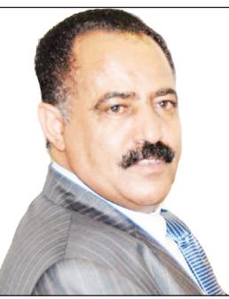
يحيى علي الراعي

الانتقالية، وكذا تفعيل أوجه نشاط العلاقات البرلمانية والاستفادة من الخبرات والتجارب الناجحة وتوظيفها لخدمة الصالح المشتركة. من جانبه عبر رئيس البرلمان النرويجي عن سعادته وشكره للاخ يحيى علي الراعي على ما احتوته رسالته من قضايا تهم الجمع وتدعو إلى تعزيز الصداقة مؤكداً تطابق وجهات النظر إزاء القضايا التي تضمنتها رسالة الصداقة. وحمل رئيس البرلمان النرويجي عضو مجلس النواب نقل تحياته إلى رئيس مجلس النواب الاخ يحيى علي الراعي . فيما قدم عضو مجلس النواب الوزير العولقي خلال زيارته للبرلمان النرويجي هدية تذكارية لرئيس البرلمان النرويجي. إلى ذلك عقد عضو مجلس النواب الوزير العولقي وبحضور رئيس البرلمان النرويجي وباقي الأعضاء الحاضرين في اللقاء مؤتمراً صحفياً في مبنى البرلمان النرويجي تحدث فيه الاخ عوض لوسائل الإعلام النرويجية عن تطورات الأوضاع في اليمن وضرورة التعاون وتعزيز علاقات الصداقة لدعم التحول الجاري في اليمن نحو المستقبل ومساعدة اليمن على تنفيذ مخرجات الحوار الوطني ومكافحة الارهاب.