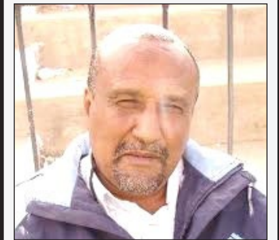
عند / خالد هيثم؛

اكملت اللجنة المؤقتة بنادي التلال، تعاقدت مع المدرب الوطني الكابتن أحمد صالح الراعي، للإشراف على فريقها الكروي خلفاً للكابتن جمال نديم المستقل بعد خسارة شعب حضرموت يوم الاثنين الماضي.