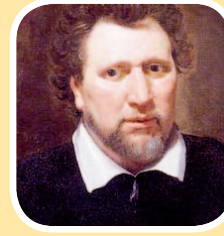
( بن جونسون )

كلما أحببت .. أحسست كأنني خلقت من جديد .. ولكن .. أليس من الغريب .. أنيعتريني .. هذا الشعور كلما مرت بي امرأة حسناء ؟