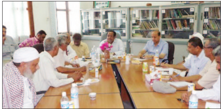
محافظ الحديدة خلال لقائه أعضاء الأحزاب والتنظيمات السياسية

المحلي في صنع القرار وفي إدارة شؤون التنمية فضلاً عن انعكاساتها الإيجابية في قطاع دابر الفساد وتسريع وتائر التنمية الشاملة. وأوضح في افتتاح اللقاء الموسع الذي عقد أمس بدبوان عام المحافظة وضم مسؤولي الأحزاب والتنظيمات