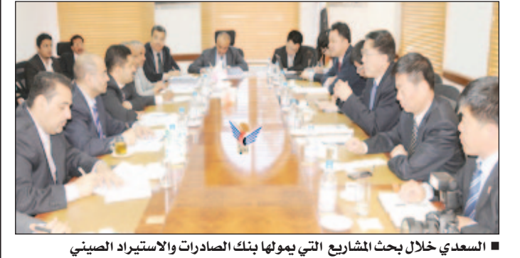
السعدي خلال بحث المشاريع التي يمولها بنك الصادرات والاستيراد الصيني

بحث وزير التخطيط والتعاون الدولي الدكتور محمد السعدي أمس مع مدير عام إدارة القروض الميسرة في بنك الصادرات والاستيراد بجمهورية الصين "لي جي تشين" جملة من القضايا المتصلة بالتعاون بين اليمن وبنك الصادرات والاستيراد الصيني وسبل تعزيزه وتطويره بما يخدم الأهداف المشتركة.