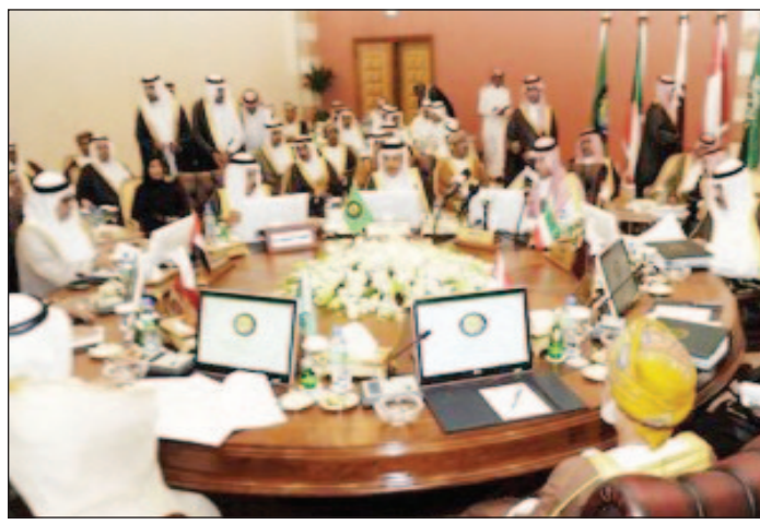
من إجتماع المجلس الوزاري الخليجي أمس

أثنى المجلس الوزاري لمجلس التعاون لدول الخليج العربية على التوافق الوطني الذي توج به مؤتمر الحوار الوطني اليمني، وعلى قرار لجنة الأقاليم بتقسيم الجمهورية اليمنية إلى ستة أقاليم. جاء ذلك في بيان أصدره مساء أمس في ختام اجتماعات الدورة الثلاثين بعد المائة للمجلس بالعاصمة السعودية الرياض. وأعرب المجلس الوزاري الخليجي عن أمله في أن يكون هذا الاتفاق خطوة من شأنها الإسهام في تحقيق الأمن والاستقرار والازدهار في اليمن، مؤكداً في ذات الوقت أن هذا الاتفاق ينسجم مع أهداف المبادرة الخليجية الرامية إلى الحرص على وحدة الجمهورية اليمنية، واحترامها لإرادة وخيارات الشعب اليمني الشقيق وحماية للسلم الأهلي والأمن والاستقرار في اليمن ومكتسباته الوطنية. وكان رئيس الدورة الحالية للمجلس - نائب رئيس مجلس