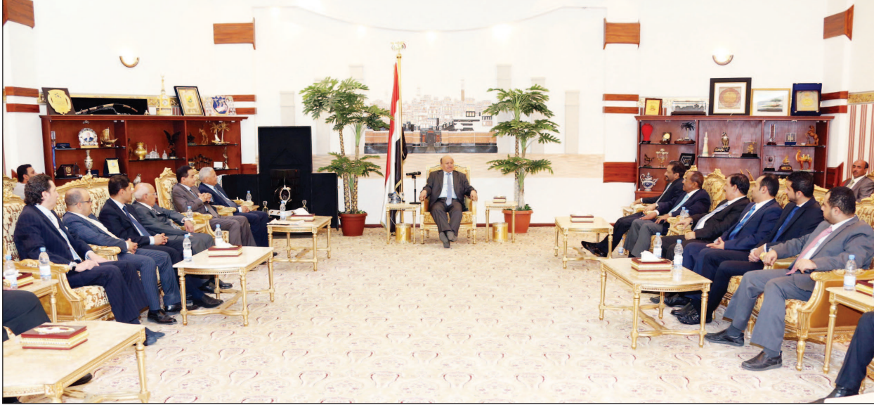
رئيس الجمهورية لدى استقباله الشخصيات الاجتماعية من رجال وسيدات الأعمال أمس

وقفت إلى الأمام في جميع قديمي بلادنا في دعم العملية الانتقالية والتغيير السلمي بما يليق بأمال وتطلعات الشعب.. مؤكداً أن مخرجات مؤتمر الحوار الوطني الشامل قد حققت كامل الأهداف. وقال «نحن اليوم نعتبر أن اليمن يتشكل بمنظومة حكم جديدة على أساس الحكم الرشيد والمشاركة في المسؤولية والسلطة والثروة من أجل العدالة، والنظام الاتحادي هو من أحدث الأنظمة