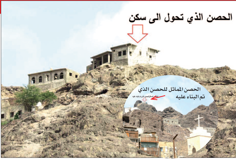
الحصن الذي تحول الى سكن