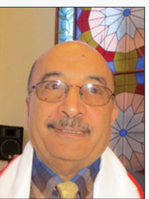
■ الصديق الاحرش