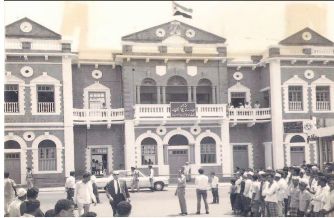
صورة نادرة لاقتتاح اول مطابع لصحيفتنا الغراء (14 أكتوبر) في قصر السلطان العبدلي في منطقة الروز ميت بكريتير نهاية السبعينات / عدن..