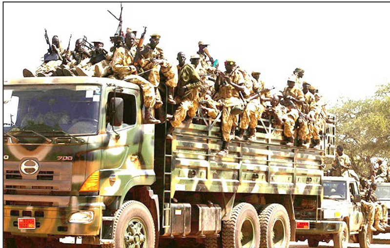
جانب من القوات الدولية

على صعيد متصل، ندت مهمة الأمم المتحدة في جنوب السودان "بالفظائع" المرتكبة في البلاد، متحدثه عن اكتشاف عدد كبير من جثث المدنيين وقتل جنود أسرى في مدن عدة. وأعربت القوات الدولية في بيان أمس الأول الثلاثاء عن قلقها إزاء "الأدلة الفاضحة المتزايدة عن انتهاكات واضحة للحقوق العالمية للإنسان المرتكبة في جنوب السودان منذ 15 يوماً".