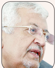
د. ياسين سعيد نعمان

في بعض النقاشات المخلقة هناك من يقول بإن الإقليم الشرقي لم يكن جزءاً من الجنوب وهذا أمر خطير .