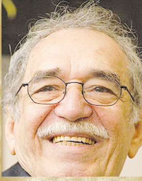
غابرييل غاريسيا ماركيز

القبيح والفقير لا ينالان أبداً ما يتيمنانه.