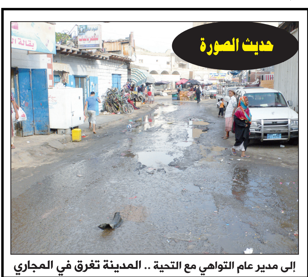
إلى مدير عام التواهي مع الطحية .. المدينة تغرق في العجاري

الميرابط صباح مساء لتحقيق الأمن والسلام الاجتماعي في المنطقة .. ودعا الشعبي عقال الحارات و المواطنين إلى التعاون المهود من أبناء تعز وغيرها من المظاهر المسلحة لجعل اليمن أكثر ازدهاراً ونفاوة الفكر وما الإعلان عن عملية مجتمعية.. مشيراً حاصل في المشورة بثقافة