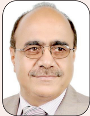
علي العمراني - وزير الإعلام

يبقى تحقيق الوحدة اليمنية أهم إنجاز تاريخي يعني منذ قرون.. ويتساءل المرء هل سيحفظ التاريخ لصناع ذلك الإنجاز بشيء من التقدير على الرغم مما حصل من أخطاء جسيمة بعد ذلك جعلت الشعب والبلد تعاني كثيراً وبصفة مستمرة ومتفاقمة، منذ أكثر من عقدين من الزمن.. بالتأكيد سيحدث التاريخ عن كل شيء وسيشير إلى الرجال والأدوار والمواقف وقد يبحث في النوايا ويفند الدعاوى.. وبقينا فإن التاريخ لن يغفل أو يغفر الأخطاء الجسيمة التي ارتكبت أثناء وبعد تحقيق الوحدة، ومن تلك الأخطاء، التسرع والارتجال ومحاولة الانفصال، وحرب 1994، والفساد الكبير الذي ساد بعد تلك الحرب، التي كان يمكن تجنبها لو سلم قادة الوحدة، من الأناية والتطرف، والحسابات الخاطئة..