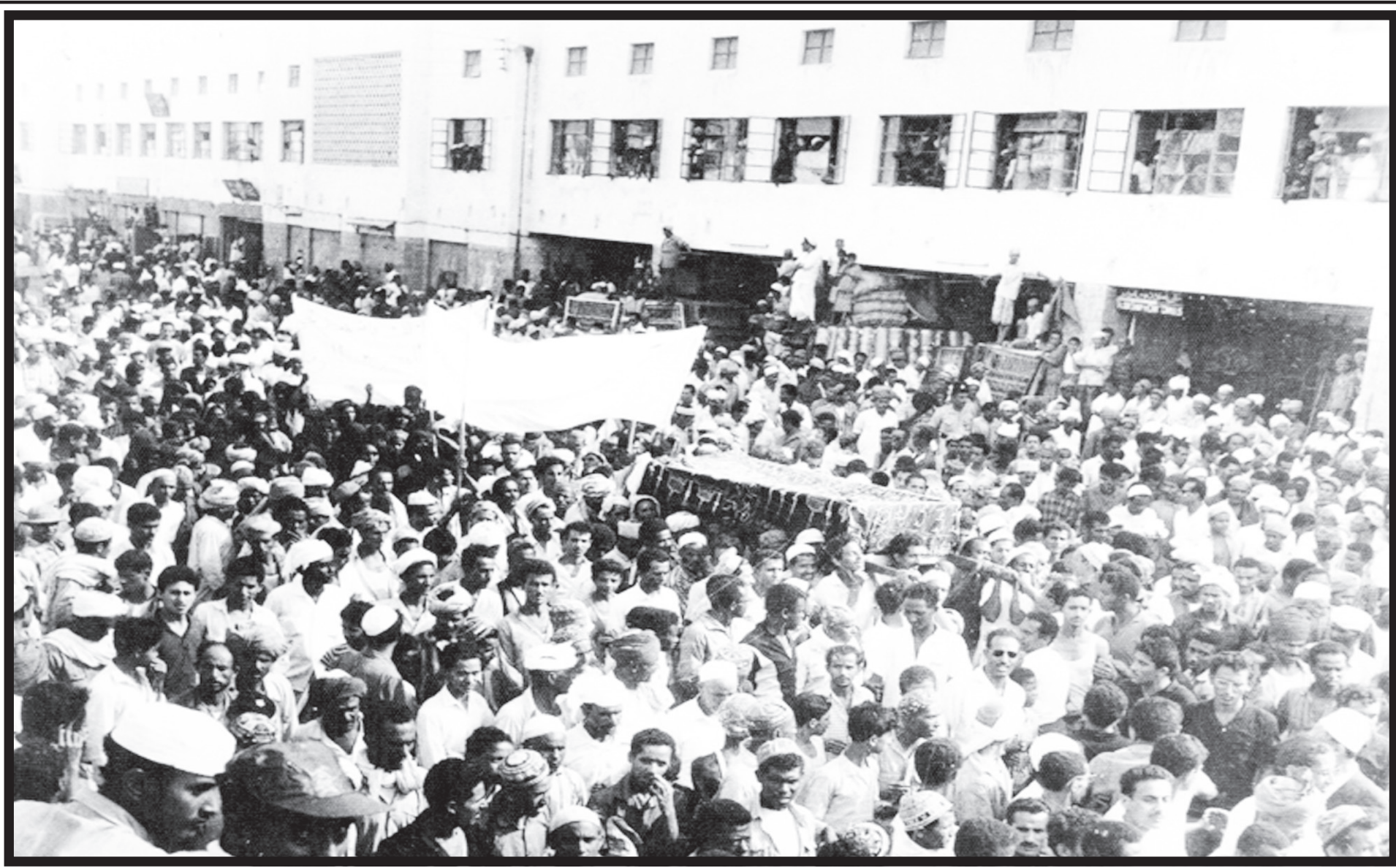
■ الجماهير تودع احد شهداء الثورة الى متواة (مسجد النور)