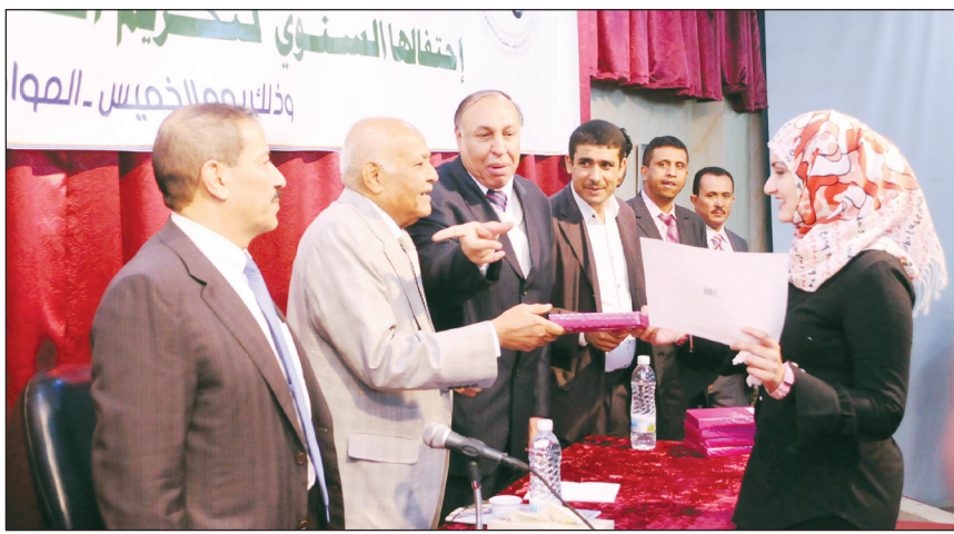
باسندوة خلال حضوره الحفل التكريمي السنوي لجامعة دار السلام الدولية

يواجهها... مؤكداً أن مسيرة التغيير ماضية إلى الأمام ولن يستطيع أن يعيقها أحد. وقال: نقوا جميعاً ان اليمن ماضية الى الاستقرار والى الامام خطوة موفقة، وان مستقبلها ان شاء الله سيكون زاها ومرهرا... وحث رئيس الوزراء جيل الشباب على التسليح بالعلم وعدم الانجرار وراء الدعوات الهدامة والثقافات الفرعية، وان يوحدوا صفوفهم، باعتبار ان ذلك هو المفتاح والعامل الأهم والأكثر تأثيراً لصنع التطور المنشود... معرباً عن أمله وتطلعه الى رؤية الشباب وهم يحملون مشاعل التطوير وقيادة وطنهم اليمن، والذي يحتاج لعطاءاتهم ومساهماتهم ذكورا واناثا. ولفت الاخ باسندوة في سياق كلمته الى تضحيات الشباب ودورهم المحوري فيما يشهده الوطن من تغيير... وقال: «لن ينسى لكم التاريخ أيها الشباب هذا الجهد الكبير والتضحيات