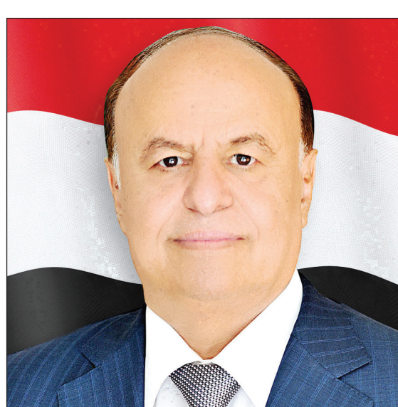
صنعاء / سبأ:

بعث الاخ الرئيس عبدربه منصور هادي رئيس الجمهورية برقية تهنئة الى الرئيس ترايان باسيسكو رئيس جمهورية رومانيا بمناسبة احتفالات الشعب الروماني بالعيد الوطني .