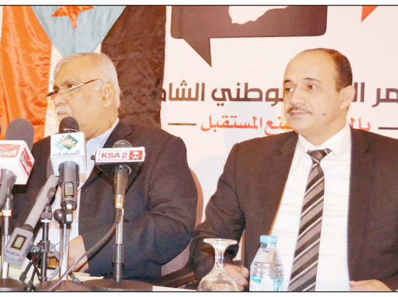
المؤتمر الصحفي للهيئة السياسية لكون الحراك الجنوبي

صنعاء / سبأ: أعلنت الهيئة السياسية لكون الحراك الجنوبي السلمي المشارك في مؤتمر الحوار الوطني الشامل، أمس، أن مكون الحراك لم ولن ينسحب من مؤتمر الحوار، داعية من قرروا الانسحاب استعمار مسؤوليتهم الوطنية والسياسية والعودة للمشاركة في المؤتمر. وقالت الهيئة في بيان سياسي لته في مؤتمر صحفي عقده، بصنعاء، بحضور عدد من القيادات الجنوبية من الحراك الجنوبي السلمي وعدد آخر من القيادات الجنوبية الاخرى المشاركة في الحوار "لم ولن ننسحب من مؤتمر الحوار الوطني مهما بلغت التضحيات وحتى لا نترك قضية الجنوب لرغبات شخص أو مجموعة أشخاص