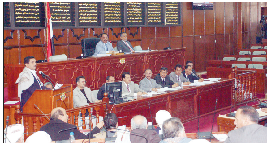
من جلسة مجلس النواب أمس

اللائحة الداخلية المنظمة لعمل المجلس وتكويناته المختلفة والحرص على الصلحة الوطنية العليا ومن متطلق المسؤولية التضامنية والتكاملية الوضع الأمني والاختلالات والحوادث الأمنية الجارية في البلد بما فيها عملية الانتخابات والتقطعات والاختلافات والتي كان ينبغي أن تناقش مجدداً بحضور رئيس وأعضاء حكومة الوفاق الوطني لتداول الآراء حول أسباب تلك المشاكل والأحداث وطرق معالجتها ونظراً لعدم حضور الحكومة الجلسة طرح نواب الشعب عدداً من الآراء والمقترحات أكدوا من خلالها أن الحكومة مقصرة في أداء مهامها ولم تتعاون وتستجيب لدعوات المجلس منذ فترة . وفي هذا الإطار قدم أعضاء