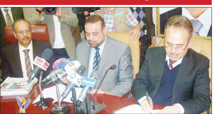
أثناء توقيع اتفاقية الشراكة الاستثمارية بين وزارة الأوقاف وأمانة صنعاء وشركة مروج

تجاري وسياحي . وخلال مراسم التوقيع قال وزير الأوقاف والإرشاد حمود عباد " ان المشروع الذي تم التوقيع عليه اليوم (أمس) مع شركة مروج سيكون المشروع النموذجي الأول في العاصمة صنعاء بكلفة 240 مليون دولار، حصة وزارة الأوقاف وأمانة العاصمة منها 17 في المائة بما يعادل 40 مليون دولار أمريكي مقابل الأرض التي سيبدا العمل فيها مباشرة مطلع عام 2014م. ولفت الوزير عباد إلى ان هذه الخطوة تأتي في إطار توجيهات الاخ الرئيس عبدربه منصور هادي رئيس الجمهورية لتقديم