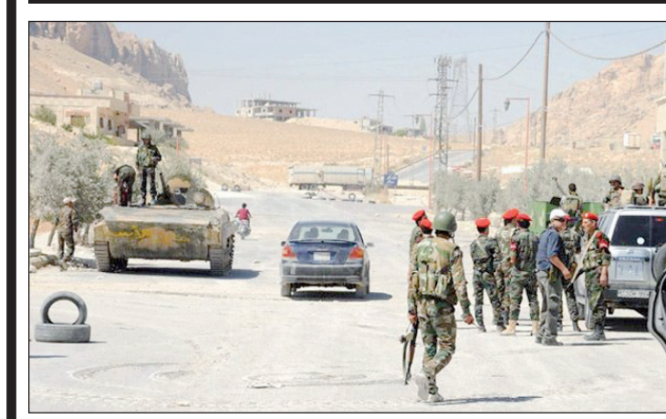
الجيش السوري خلال تطهير بلدة دير عطية

في سوريا. وكان الجريا قد وضع شروطاً في وقت سابق، وقال ان ائتلافه لن يشارك في مؤتمر «جنيف 2» اذا شاركت ايران، مصرًا على انه لا يمكن للرئيس السوري بشار الاسد ان يلعب اي دور في المستقبل في سوريا. وأعلنت الخارجية السورية رسمياً مشاركة دمشق في المؤتمر. وقالت في بيان الأربعاء ان الرئيس السوري الاسد سيرسل وفداً رسمياً إلى مؤتمر جنيف. وأكدت دمشق أن مشاركتها في مؤتمر «جنيف 2» ليست لتسليم السلطة أو لاستبعاد الرئيس بشار الاسد من العملية الانتقالية.