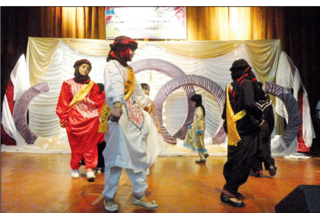
ولفت أمير إلى أهمية توطيد حب الوطن والالتزام له في البناء والتنمية مؤمنين ومشارف تحقيق الغايات النبيلة.

تعز / تعز / نغائم خالد: احتفلت أمس جامعة تعز في المركز الثقافي بتخرج 64 طالباً وطالبة الدفعة الأولى من نظم المعلومات الإدارية (Mis) في الحكومة الإلكترونية.