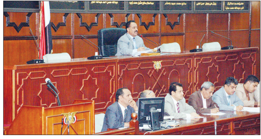
■ من جلسة مجلس النواب أمس

والمنفذين لها إلى القضاء لنبالوا جزاءهم العادل . وحملت المناقشات الحكومة مسؤولية ما حدث بهذا الشأن . ولفت نواب الشعب إلى أن تلك الأحداث الإجرامية والإرهابية تأتي مخالفة للقوانين والنظام والسكينة العامة وتستهدف إثارة الفتن والتحريض السياسي والفكري والباطني والمذهبي . ودعا أعضاء المجلس إلى القضاء على تلك الظواهر وتجنيف منابيحها لخلق ظروف ملائمة للسكينة العامة وتوفير البيئة الجاذبة للاستثمار والنهوض بالأوضاع الاقتصادية والمالية والإدارية ومعالجة أمراض الفساد أينما وجدت ومن أي جهة كانت بالاستناد إلى القوانين ذات الصلة . ودعت مناقشات وملاحظات آراء نواب الشعب وسائل الإعلام وكافة أدوات الاتصال الجماهيري ومراكز الإشعاع والتثوير العلمي والعاملين في مجال الوعظ والإرشاد إلى تحري الدقة والموضوعية والمصادقية والمهنية في عملها