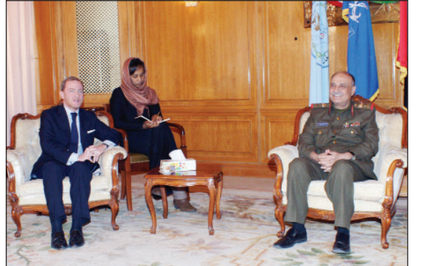
■ وزير الدفاع لدى لقائه السفير الفرنسي أمس

إلى ذلك التقى وزير الدفاع، سفير جمهورية إيطاليا الصديقة بصنعاء لوشيانو جالي ومعهم ممثل وزارة الخارجية الإيطالية الذي يزور بلادنا حالياً. وجرى خلال اللقاء بحث أوجه التعاون المشترك بين البلدين الصديقين، لاسمياً التعاون في المجالات العسكرية وفي مقدمتها تبادل الخبرات والتأهيل والتدريب العسكري والتعاون في مجال مكافحة الإرهاب. كما جرى استعراض الأوضاع في اليمن ومنها ما توصل إليه مؤتمر الحوار الوطني الشامل والذي يشرف على الانتهاء