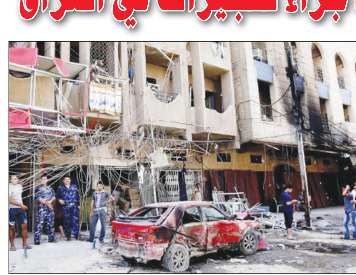
■ من أثار أحد التفجيرات في العراق

وفرضت قوات الأمن تدابير أمنية مشددة في المناطق التي وقعت فيها التفجيرات، ولم تعلن أي مجموعة على الفور مسؤوليتها عن هذه الاعتداءات.