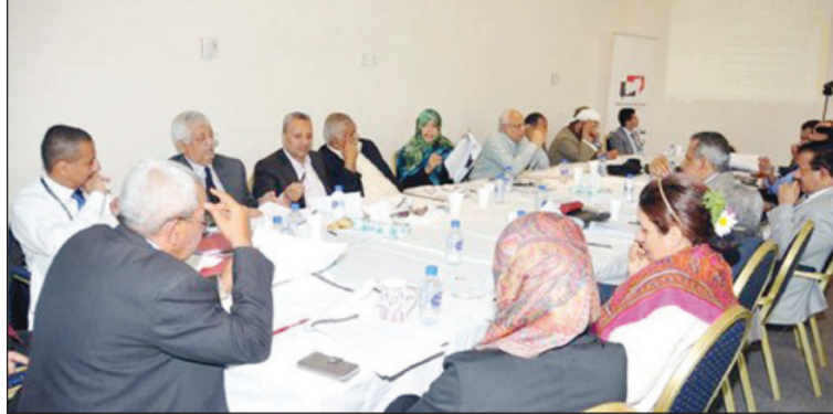
■ لجنة توفيق الآراء بمؤتمر الحوار الوطني / ارشيف

المواد المختلف عليها في لجنة التوفيق، ووضعه على فريق العدالة الانتقالية لإقراره ورفعها للجلسة العامة. وينكر أن فريق العدالة الانتقالية أقر 107 مواد من مجموع 159 مادة يتضمنها تقريره النهائي وإحال بقية المواد إلى لجنة التوفيق.