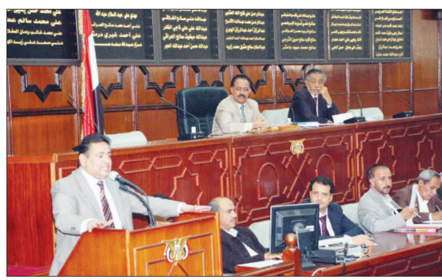
■ من جلسة مجلس النواب أمس

■ صنعاء / سيأ: استمع مجلس النواب في جلسته أمس برئاسة رئيس المجلس يحيى علي الراعي إلى تقرير الحكومة عن النتائج الإجمالية للحسابات الختامية للموازنة العامة للدولة والحسابات الختامية لموازنتها الوحدات المستقلة والصناديق الخاصة والحسابات الختامية لموازنتها وحدات القطاع الاقتصادي العام والمختلط