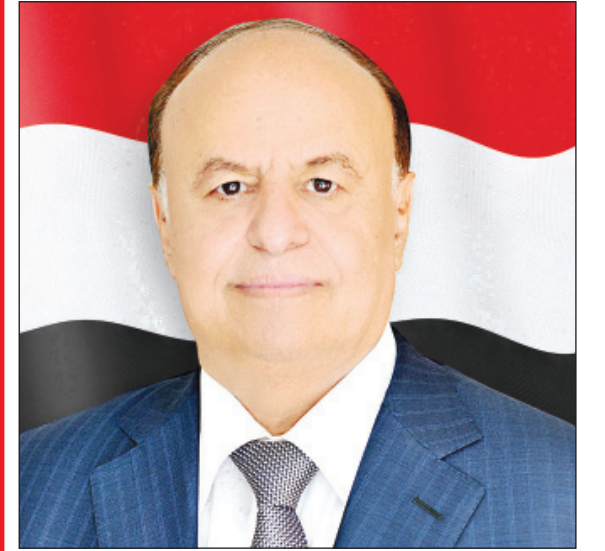
■ صنعاء / سيأ:

بعث الاخ الرئيس عبد ربه منصور هادي رئيس الجمهورية برقية عزاء ومواساة إلى وضاح محمد حمود محسن الصباحي وجميع احوالته وكافة افراد أسرته وذلك في استشهاد والدهم العميد محمد حمود محسن الصباحي اركان حرب قوات الامن الخاصة فرع حضرموت، أثناء ادائه الواجب ومشاركته البطولية في التصدي للعناصر الارهابية في مدينة الشحر فجر امس الاول الاربعة . وأشار الاخ الرئيس في برقيته إلى مكانة الشهيد الوطنية والعملية من خلال ثباته وإخلاصه في مهامه خلال مشوار حياته العملي .. مبتهلاً إلى المولى عز وجل ان يتعمد الشهيد الراحل بواسع رحمته وان يلهم اهله وذويه الصبر والسلوان . "انا لله وانا اليه راجعون".