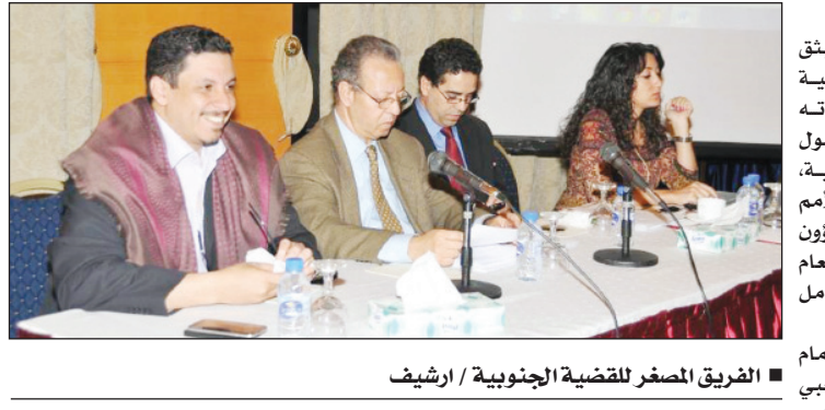
■ الفريق المصغر للفوضية الجنوبية

عملية التقسيم إلى برلمان منتخب بالمنافسة بين شمال الوطن وجنوبه. كما واصل الفريق المصغر مناقشة مصفوفة الرؤى المعروضة عليه من قبل المكونات من أجل تحديدها أقربها إلى تحقيق أكبر توافق ممكن. وأقر في ختام اجتماعه مواصلة اجتماعاته مساء اليوم الجمعة.