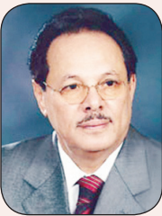
علي ناصر محمد

كانت هناك محاولات لخطط الأوراق على الحراك الجنوبي والصفاق تهمة الإرهاب والارتباط بالقاعدة بغرض النيل منه ومن رسالته السلمية الحضارية إلا أن هذه المحاولات باءت بالفشل، وإذا كانت لبعض الأفراد علاقة تاريخية بالقاعدة فلا تنعكس على الحراك كحركة شعبية سلمية شهد لها العالم وكذلك الحال بالنسبة لمن له علاقة بإيران أو غيرها من الدول.