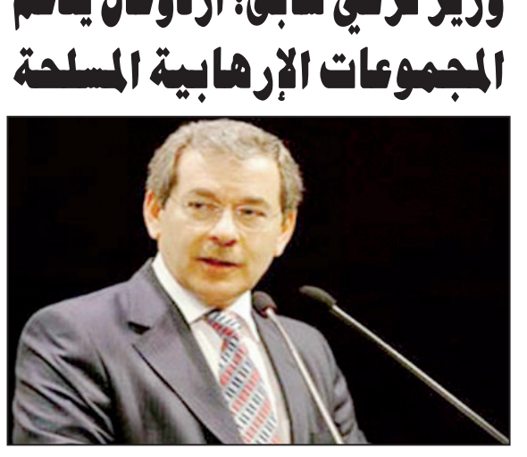
عبد اللطيف شتر

أكد الوزير التركي السابق عبد اللطيف شتر أحد مؤسسي حزب العدالة والتنمية أن رئيس الوزراء التركي رجب طيب أردوغان يدعم التنظيمات الإرهابية التي ترتكب الجرائم الوحشية في سورية محملاً «المعارضة السورية والحكومة التركية مسؤولية المجازر المرتكبة ضد المدنيين في سوريا». وقال شتر في مقابلة أجرتها معه صحيفة (يورت) التركية حول السياسة التي تمارسها حكومة حزب العدالة والتنمية إزاء سورية إن جميع المجموعات المعارضة في سورية نفذت أعمالاً إرهابية ضد المدنيين. مؤكداً أن حكومة حزب العدالة والتنمية توزع الابتسامات أمام الجرائم التي ترتكب ضد أبناء الشعب السوري بدلا من أن تتعزب بالخجل والعار من ذلك. واعتبر شتر الذي استقال من منصب وزارة المالية وحزب العدالة والتنمية نتيجة خلافه مع أردوغان أن الاقتداء للديمقراطية يعد أهم مشكلة تواجهها تركيا وحكومته منذ البداية والتنمية مبينا أنه لا يمكن مساهمة حكومة أردوغان حول الأخطاء ومناسبة سياساتها أمام الرأي العام حيث آلاف الصحفيين يعملون من أجل تغطية خطأ أردوغان وإرضائه. وأشار إلى أن تنامي مشاكل تركيا نتيجة عدم طرح الأخطاء للنقاش ومساعي الوسائل الإعلامية الرامية إلى إيجاد الذرائع المنطقية لأخطاء حكومة حزب العدالة والتنمية. ورأى شتر أن أردوغان يسعى إلى خلق العداوة بين أبناء الشعب الواحد وتعميق الاستقطاب في المجتمع من خلال الأسلوب الذي يمارسه، موضحا أنه ألقى الرقابة أي «إمكانية مراقبته، من قبل الرأي العام عبر قمع الوسائل الإعلامية».