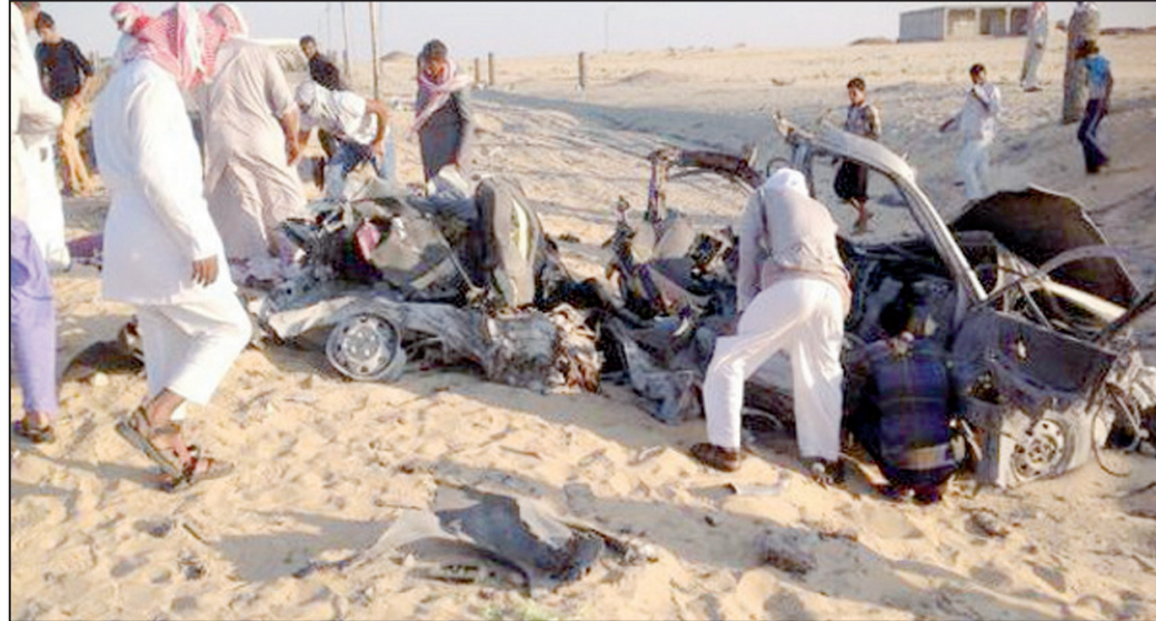
السيارة المفخخة التي انفجرت في الجنود بسينا

وقال مصدر أمني بشمال سيناء، إن مؤشرات التحقيقات الأولية في حادث تفجير العريش تشير إلى تورط جماعة أنصار بيت المقدس في هذا الحادث، مؤكدة أن مجرياته تمت بنسب طريقة العمليات الانتحارية السابقة التي شهدتها شمال سيناء . وتابع المصدر، أن الحادث بضع وتشير