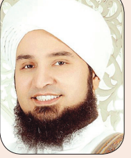
الحبيب علي الجفري

عن الحرب التي تدور في قرية دماج وما يحيط بها من منطقة صعدة في اليمن، وعن حشد الشباب لها من مختلف المناطق، والجواب لن سأل: