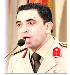
■ أحمد علي

قال العقيد أركان حرب أحمد علي المتحدث العسكري المصري إن عناصر إنفاذ القانون من القوات المسلحة والشرطة المصرية، واصلت ضربياتها الأمنية لاقتلاع جذور الإرهاب والجريمة المنظمة من شمال سيناء. وأضاف في بيان له، أنه خلال عملية أمنية ناجحة جديدة نفذتها عناصر الجيش الثنائي الميداني، من خلال عمليات مدهامات وتشهيط بقري المهديفة ونجع شبانة والسكاسة ودرغام والتلول وأبو طويلة مصفق، تم القضاء على 3 أفراد من العناصر التكفيرية بقرية المهديفة أثناء قيامهم بإطلاق النيران على عناصر إنفاذ القانون، وخلال أعمال تبادل إطلاق النيران أصيب أحد الجنود بطلق ناري في الساق اليمنى، وحالته العامة «مستقرة»، وتم ضبط 6 من المشتبه في تورطهم في أعمال عنادية ضد عناصر القوات المسلحة والشرطة، وضبط 3 فلسطينيين. وأشار إلى أن القوات تمكنت من إزالة 30 عشة ومنزلا