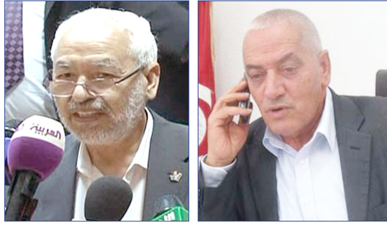
■ حسين العباسي ■ راشد الغنوشي

اعتبرت أن سنه لا يسمح له بالحكم. وقالت المعارضة التي أيدت ترشيح محمد الناصر (79 عاماً)، إنها اقترحت أسماء أخرى، لكن بلا جدوى. ويهدف الحوار الوطني الذي بدأ في 25 أكتوبر إلى إخراج تونس من أزمة سياسية عميقة تردت فيها منذ اغتيال النائب المعارض محمد البراهمي في 25 يوليو الماضي في جريدة نسبت إلى الإسلاميين المتطرفين. وكانت الحكومة التي يقودها الإسلاميون أعلن الاتحاد العام للشغل في تونس فشل الحوار الوطني بسبب عدم التوصل لاتفاق بشأن اسم رئيس الوزراء الجديد. وعلى إثر ذلك تم تعليق المحادثات، فيما أرجعت مصادر أسباب فشل المحادثات إلى رفض الرئيس منصف المرزوقي ترشح وزير الدفاع السابق عبدالكريم الزبيدي لرئاسة الحكومة. وأوضح الأمين العام للاتحاد العام للشغل في تونس، حسين العباسي، أنه لم يتم التوصل إلى توافق خلال محادثات أمس الأول الاثنين، مضيفاً: "لقد قررنا إيقاف هذا الحوار حتى نوجد له أرضية صلبة لنجاحه". ولم يتضح متى ستستأنف المفاوضات. وأضاف: "لم نتوصل إلى توافق على الشخصية التي ستترأس الحكومة، حاولنا تدليل الصعوبات لكن لم يحصل توافق" من جانبه، قال راشد الغنوشي، زعيم حركة "النهضة" الإسلامية التونسية، إنه بات واضحاً أن سبب تعليق الحوار هو الفشل في تسمية رئيس حكومة. وقال الغنوشي إن حركته لم تر أي سبب لرفض ترشيح أحمد المستيري، ولا سيما أنه الشخصية الأكثر استقلالية بين المرشحين. ودافع حزب "النهضة" بشراسة عن تعيين المستيري (88 عاماً) الشخصية المعروفة في الحياة السياسية التونسية، لكن المعارضة