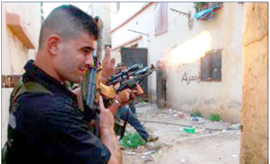
■ جانب من الوحدات العسكرية التي شكلت على اساس قبلي وطائفي في ليبيا