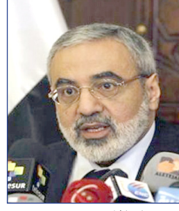
■ عمران الزعبي

اعلن وزير الاعلام السوري عمران الزعبي ان حكومة الرئيس بشار الاسد سيكون رئيسا لهذه البلاد في جميع الاوقات التي يحلمون ألا يكون رئيسا فيها.. وتأتي تصريحات الزعبي في وقت تبذل الولايات المتحدة وروسيا والامم المتحدة جهودا لعقد مؤتمر جنيف 2 بمشاركة ممثلين للحكومة السورية والمعارضة، سعيا للتوصل إلى حل سياسي لازمة المستمرة منذ منتصف مارس 2011، واودي بحياة الآلاف الأشخاص. وتطالب المعارضة المنقسمة حول المشاركة في المؤتمر، بأن يشمل اي اتفاق ضمانات برحيل الاسد، وهو امر مرفوض لدى دمشق. اعلن عمران الاعلام السوري عمران الزعبي ان حكومة الرئيس بشار الاسد سيكون رئيسا لهذه البلاد في جميع الاوقات التي يحلمون ألا يكون رئيسا فيها.. وتأتي تصريحات الزعبي في وقت تبذل الولايات المتحدة وروسيا والامم المتحدة جهودا لعقد مؤتمر جنيف 2 بمشاركة ممثلين للحكومة السورية والمعارضة، سعيا للتوصل إلى حل سياسي لازمة المستمرة منذ منتصف مارس 2011، واودي بحياة الآلاف الأشخاص. وتطالب المعارضة المنقسمة حول المشاركة في المؤتمر، بأن يشمل اي اتفاق ضمانات برحيل الاسد، وهو امر مرفوض لدى دمشق.